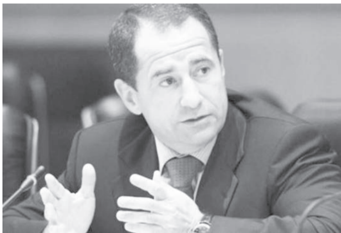
Михаил Бабич, полпред Президента РФ в ПФО:

По результатам отчетов уполномоченных, анализ обозначенных в обращениях вопросов свидетельствует о сохранении тенденции не-