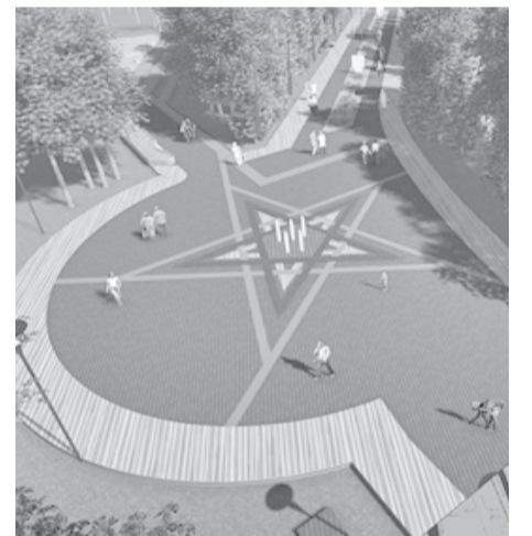
Вариант главной аллеи в парке Победы

- С сентября по май жизни в парке практически нет, и это недопустимо. Парки - это дома культуры под открытым небом. На основе предложений жителей города мы разработаем ульяновский стандарт осенне-зимнего отдыха, в котором учтем также московский опыт благоустройства парков, - заявил глава региона.