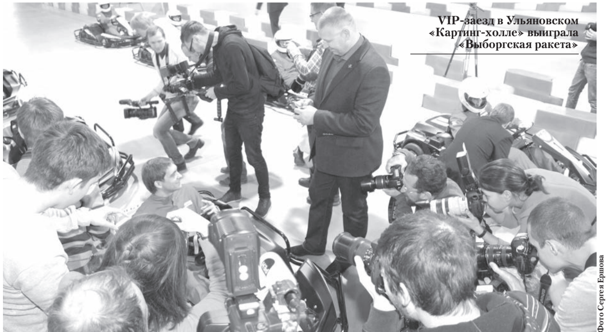
VIP-заезд в Ульяновском «Картинг-холле» выиграла «Выборгская ракета»