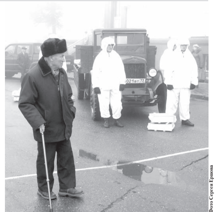
Одним из центральных мероприятий стала выставка продукции ульяновских предприятий тех лет под названием «Ульяновцы: Все для фронта! Все для победы!»

После выступления губернатора жители региона пронесли плакаты с лозунгами, аналогичные тем, которые были в 1941 году, а также фотографии родственников, не вернувшихся с Великой Отечественной войны. Отдельную колонну составили коллективы организаций и предприятий, правопреемников тех, кто 73 года назад вышел на общегородскую демонстрацию трудящихся Ульяновска. Таковых сегодня в городе более 40. У каждой организации, участвующей в шествии, был свой специально изготовленный транспарант с ее историческим и современным названием. В реконструкции приняли участие воспитанники кадетских классов Ульяновской области, а также члены военно-патриотических клубов. Всего на площадь вышли более трех тысяч человек.