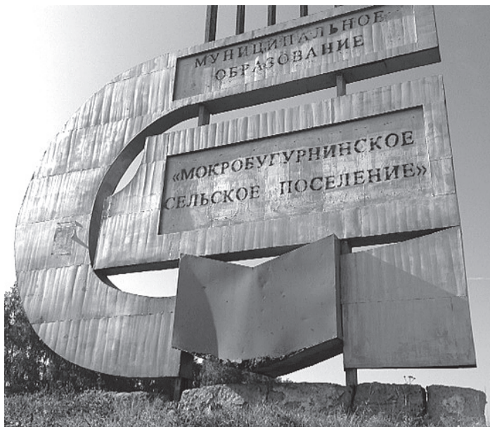
Въезд в село Мокрая Бугурна совершенно не радует глаз

Пустые бутылки и обертки от мороженого валяются на автобусной остановке. Ее, кстати, было бы хорошо покрасить. Даже невооруженным взглядом было видно, что