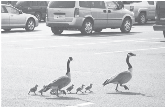
Самое ценное и хрупкое на дороге - жизнь живого существа

«Напомним, в июне этого года губернатор выступил с