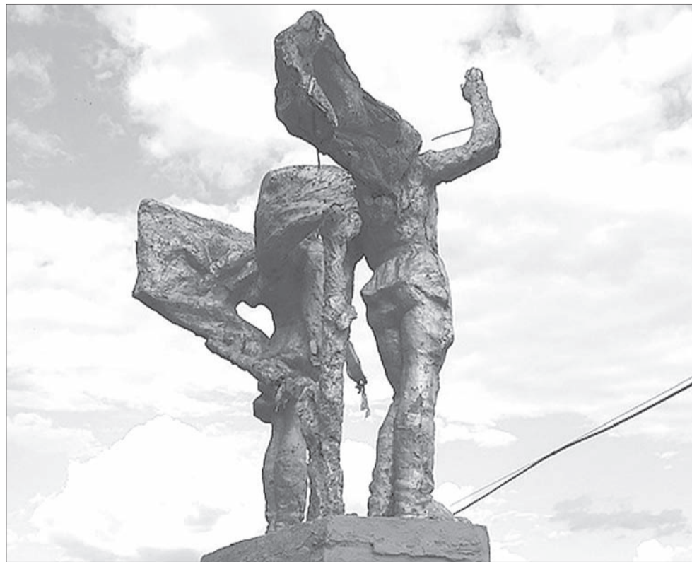
Вот на этом бинте держится наша память о Великой войне и ее солдатах