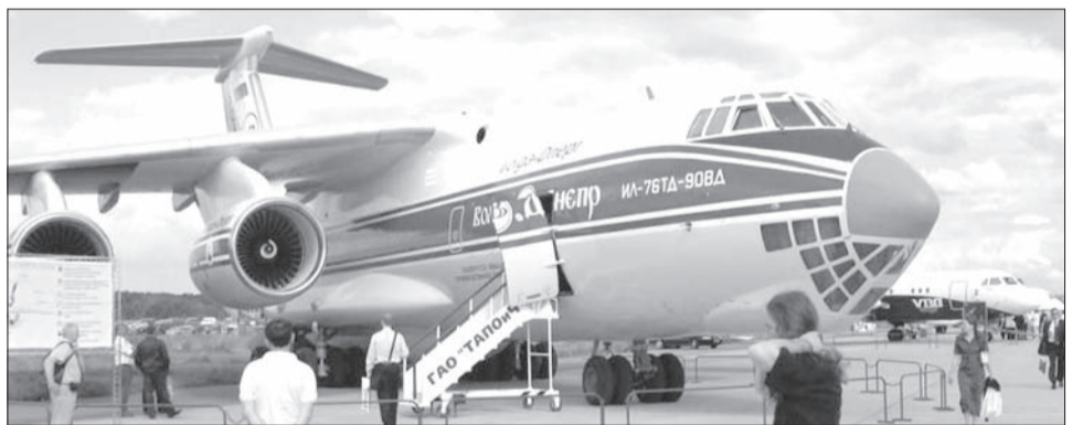
Справка «Ульяновской правды»