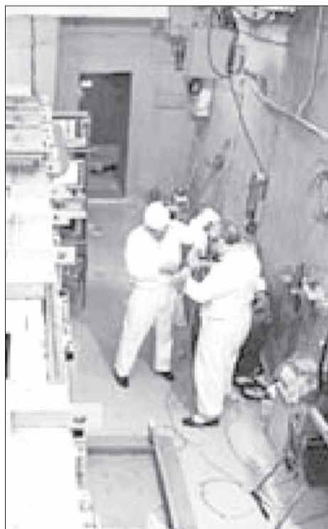
ствуют, и тогда привычная картина мира претерпит существенные изменения.