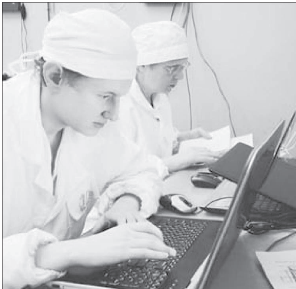
На пути создания полномасштабного детектора «Нейтрино-4» еще много работы

Эксперимент не может не вызывать интереса со стороны мирового научного сообщества, ведь нейтрино сейчас наименее изученная элементарная частица. Не исключено, что исследования докажут, что стерильные нейтрино суще-