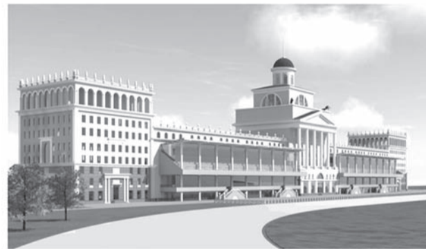
Перспективный вид на трибуны