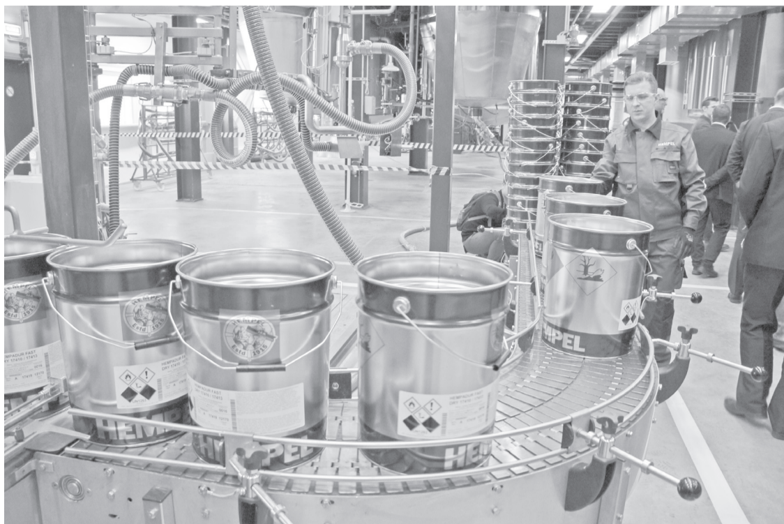
Среди 11-ти крупных инвестиционных проектов, реализованных в области в 2015 году, лакокрасочный завод датской компании Hempel.