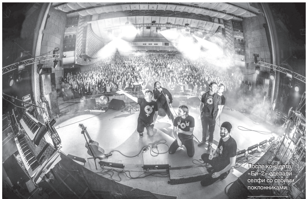
После концерта «Би-2» сделали селфи со своими поклонниками.

Билеты на выступление «Би-2» начали раскупать сразу же после старта продаж - за пару недель до события лишний билетик было не найти днем с огнем. В Ульяновск музыканты приехали простыми. А это, по сути, уже грозит срывом или переносом мероприятия. Спасли ситуацию местные врачи, которых Шура и Лева поблагодарили во всеуслышание по ходу концерта. Выздоровевшая группа подарила Ульяновску два часа качественной рок-музыки, направленной световыми и звуковыми эффектами. Музыканты смогли зажечь зал с первых минут. Иногда казалось, что это группа «Би-2» пришла на концерт, а не наоборот - хлопали, пели, кричали и топали решительно все. В конце своего выступления группа пообещала совсем скоро вернуться на ульяновскую сцену.