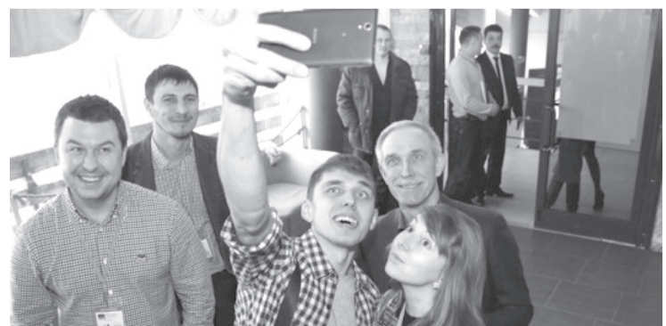
Селфи с губернатором.

Напомним, что по инициативе губернатора Сергея Морозова в Ульяновской области с 1 января этого года ставка по налогу на прибыль для учреждений, работающих по классической системе налогообложения, составляет 13,5 процента. Для компаний, имеющих аккредитацию в Минкомсвязи и применяющих упрощенную систему налогообложения, ставка снижена до одного процента. Кроме того, нулевая налоговая ставка установлена для вновь зарегистрированных компаний, работающих по патентной системе.