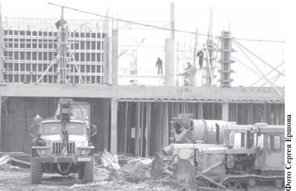
Промзона «Заволжье» внесла весомый вклад в рост ВРП

Необходимо отметить последовательное снижение количества безработных в области: уровень общей безработицы снижен с 7,7 процента в 2005 году до менее 4,5 процента. В настоящее время Ульяновская область максимально приблизилась к уровню полной занятости, что статистически оценивается по величине уровня регистрируемой безработицы в 0,5 процента. По регистрируемой безработице регион занимает 1-е место в ПФО как субъект с минимальным уровнем регистрируемой безработицы.