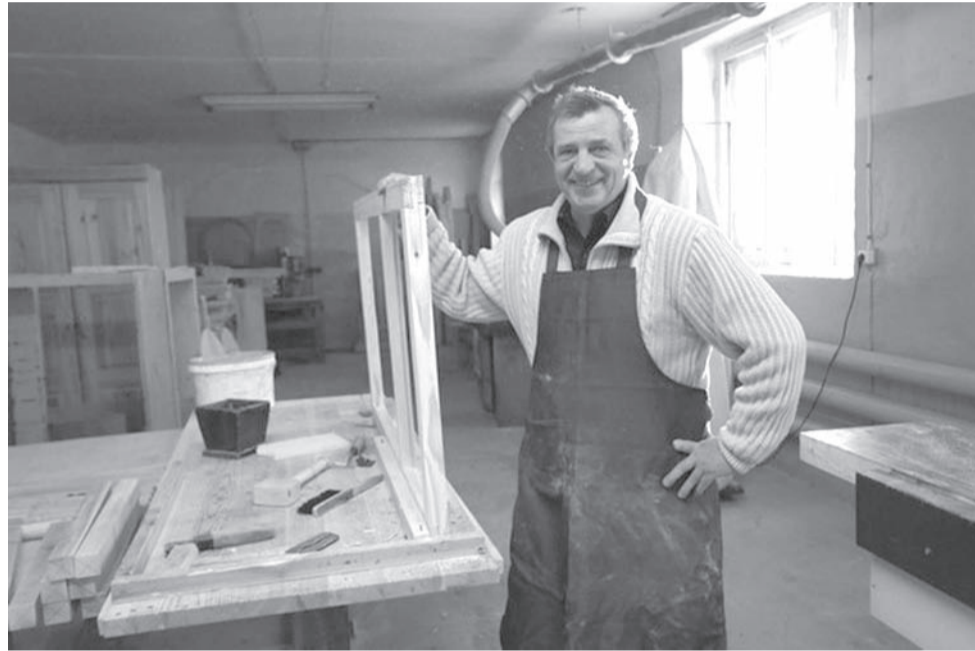
Леспромхоз в Шарлово будет модернизирован

- Учитывая многопрофильность лесной отрасли, подход к ее дальнейшему