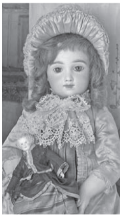
Игрушка - забава, но ей все рады