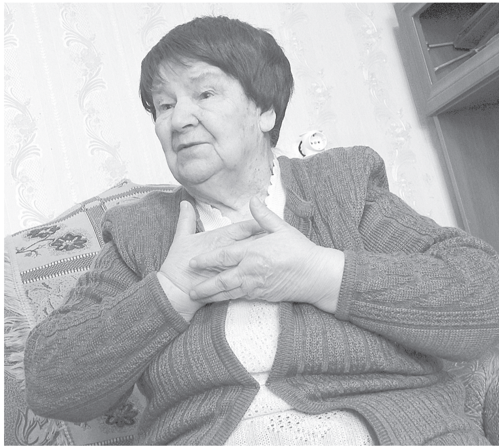
Семь десятилетий не изгладил из памяти ужасов блокады