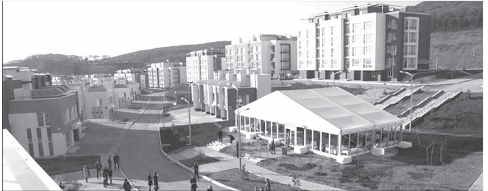
Новый жилой микрорайон в районе бухты Патрокл во Владивостоке вырос на участках фонда «РЖС»

Сейчас земля, на которой предполагается начать строительство, находится в федеральной собственности. После аукциона определится застройщик, которому она будет передана на 7 лет (срок реализации проекта) в безвозмездное пользование, а земельный налог за него будет платить фонд «РЖС». Торги пройдут по так называемой голландской схеме, то есть на понижение ставок. Начальной ценой аукциона является цена продажи одного квадратного метра жилья экономического