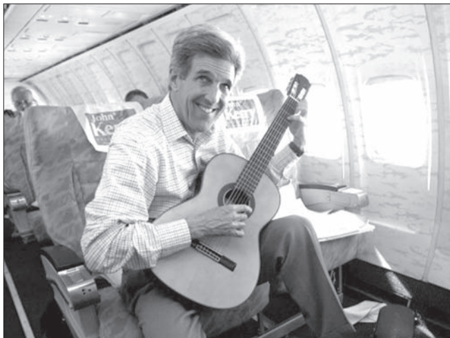
↑ В Ульяновске учредили ежегодный творческий фестиваль-конкурс для чиновников «Звезда губернии». К заявке на конкурс «госталанты» должны будут приложить копию своего служебного удостоверения. Проводить конкурс будут в канун Дня местного самоуправления, который отмечается 21 апреля.