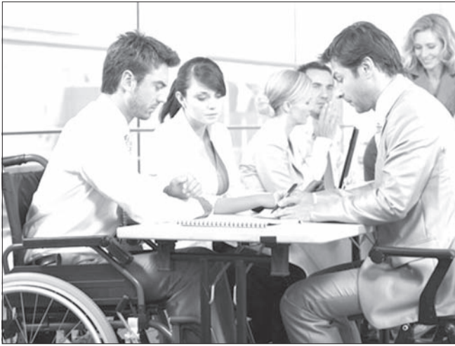
↑ Инвалидам и пожилым ульяновцам предлагают работу - в Ульяновске прошла специализированная ярмарка вакансий. На нынешний день наибольшее число рабочих мест отмечено в Заволжском районе Ульяновска - 3978, Ленинском - 2390, Засвияжском - 2204, Железнодорожном - 1359.