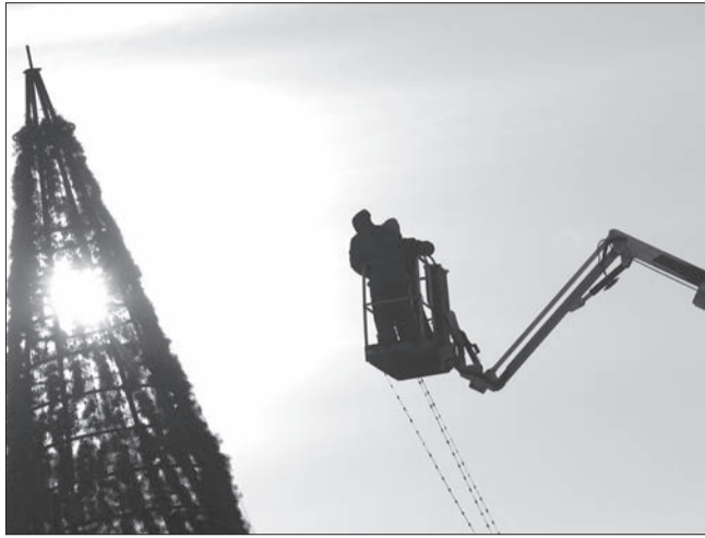
↑ Регион начал активную подготовку по праздничному оформлению к Новому году. В этом году Ульяновск заблистает огнями уже к 10 декабря, а на главной площади Димитровграда будет установлена новая искусственная ель.