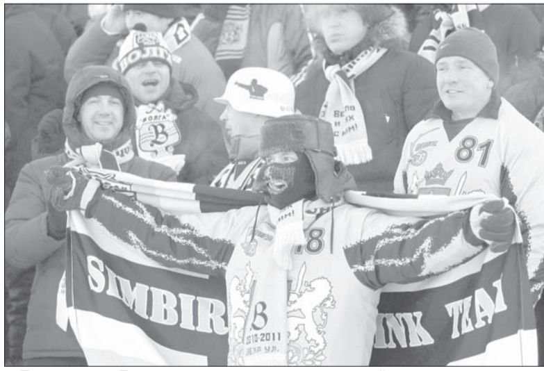
Болельщики «Волги» в предвкушении нового хоккейного сезона