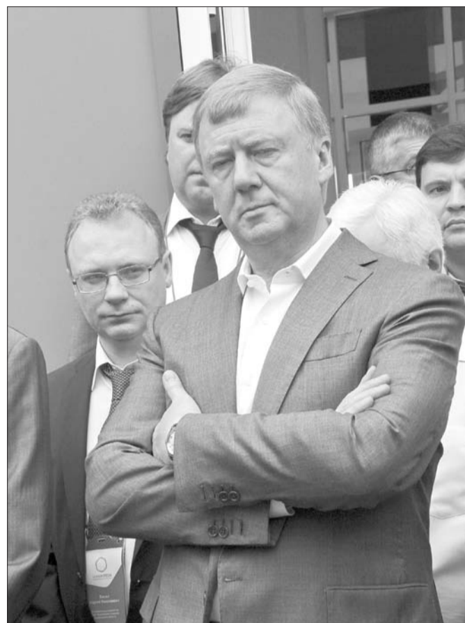
Анатолий Чубайс предпочитает костюм без галстука

- Никогда не старался гнаться за модными тенденциями, брендами, отдавая предпочтение той одежде, которая для меня наиболее комфортна и, желательно, находится вне времени и стиля. Вместе с тем внешний вид должен всегда соответствовать обстановке. Классический костюм, на мой взгляд, соответствует всем этим параметрам лучше всего. Очевидно, что лучше выбирать изделия из натуральной ткани - стараюсь всегда придерживаться этого принципа. Обращаю внимание на то, чтобы структура материала позволяла долго носить костюм и сохранять его опрятным. Работать приходится в разных режимах - официальные мероприятия могут следовать после разездов, во время которых костюм может терять форму. Соответственно, чем тоньше ткань, тем легче она мнется, и этот вариант мне не подойдет. Потому прежде всего смотрю на плотность костюмного материала.