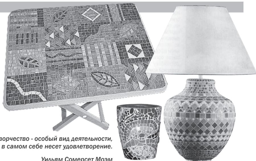
Творчество - особый вид деятельности, оно в самом себе несет удовлетворение.

Оформление бытовых предметов: столиков, светильников, шкапулок, зеркал, цветочных горшков керамическими плитками и осколками битой посуды дают широкий простор фантазии.