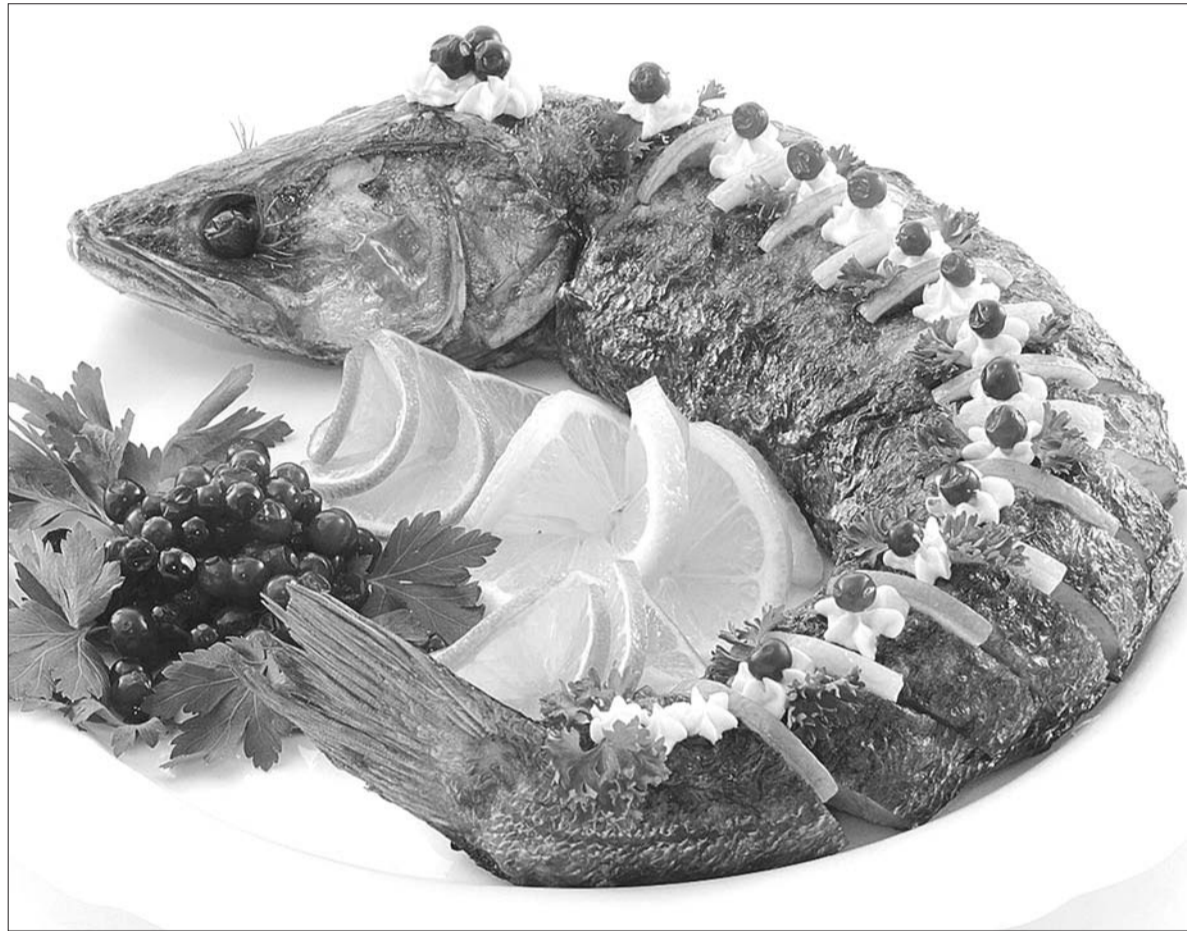
Волжского судака столичные гости считают кулинарным брендом Ульяновска

- Во-первых, это источник «легкого» белка, ведь рыба усваивается организмом значительно лучше и быстрее, чем мясо или птица. Кроме этого, рыба содержит ряд полезных микроэлементов - железо, фосфор, кальций, магний, цинк, селен. Особенно ценится в этом плане охлажденная морская рыба, содержащая фтор и йод, которых так не хватает жителям России. Одно из самых больших преимуществ морских рыб - это высокое содержание полезных для организма человека полиненасыщенных жирных кислот и витаминов, в том числе А и D. Свои полезные свойства есть у каждой рыбы. Например, стерлядь - естественный антиоксидант, один из лучших источников жирных кислот, сибас известен малым содержанием жира, поэтому идеален для диетического питания. Лосось помогает сохранять молодость и здоровье кожи за счет высокого содержания жира. Именно поэтому любителей рыбы становится все больше. Люди стали следить за своим здоровьем, многие стали ходить на фитнес и в тренажерный зал, некоторые