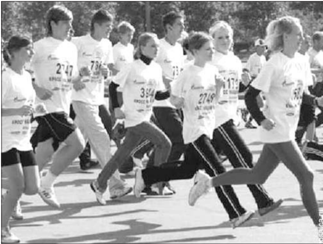
Ульяновская область примет участие во Всероссийском дне бега «Кросс нации - 2013». Массовый забег состоится 22 сентября. Запланировано участие более пятнадцати тысяч жителей региона - это один из самых высоких показателей по Российской Федерации.