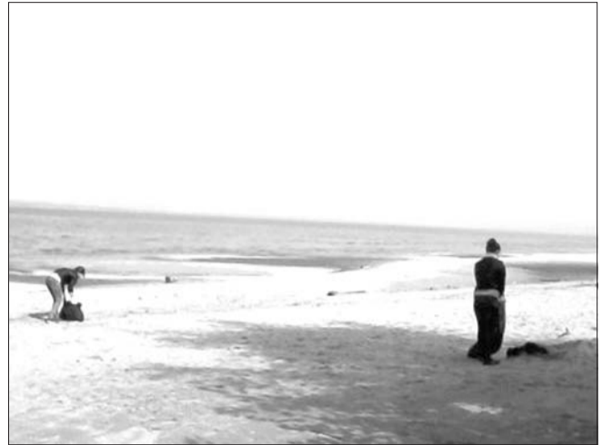
↑ В регионе проходит второй этап ежегодной экологической акции «Дни чистой Волги». В рамках акции добровольцы убрали мусор на прибрежных полосах в границах поселений семи МО, по которым пролегает русло Волги и ее заливов.