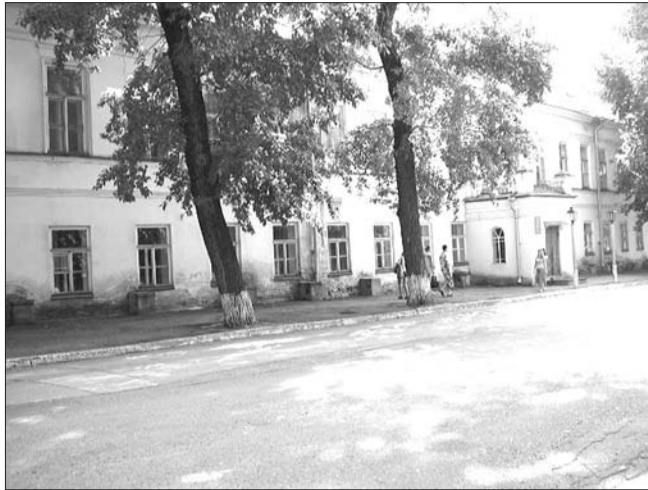
↑ Пять школ Ульяновской области вошли в число 500 лучших общеобразовательных учреждений России. От нашего региона в рейтинг попали многопрофильный лицей № 20, гимназия № 1, Мариинская гимназия, городская лицей при УЛГТУ и городская гимназия Димитровграда.