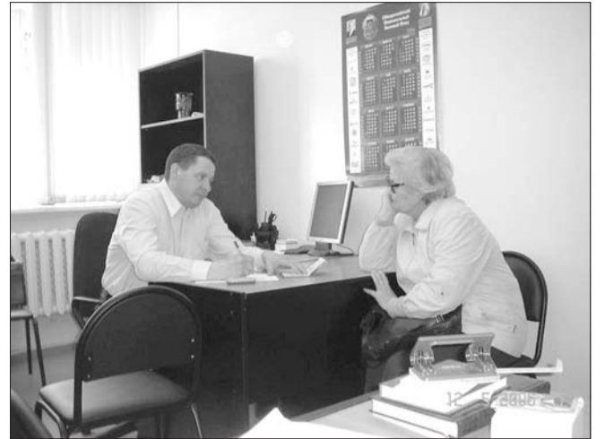
Более трехсот пунктов оказания бесплатной юридической помощи работают сегодня в регионе при администрациях всех муниципальных образований Ульяновской области.