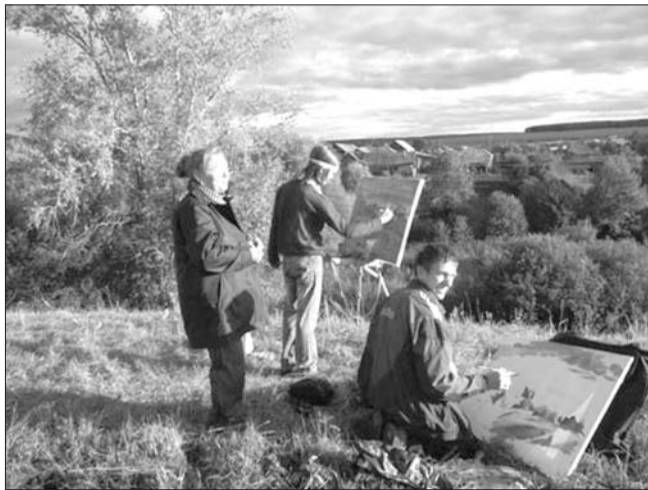
С 18 по 24 сентября в рамках Международной ассамблеи художников «Платовская осень» на родине Аркадия Платова в селе Прислониха проходит Международный пленэр художников «Мир на кончике кисти».