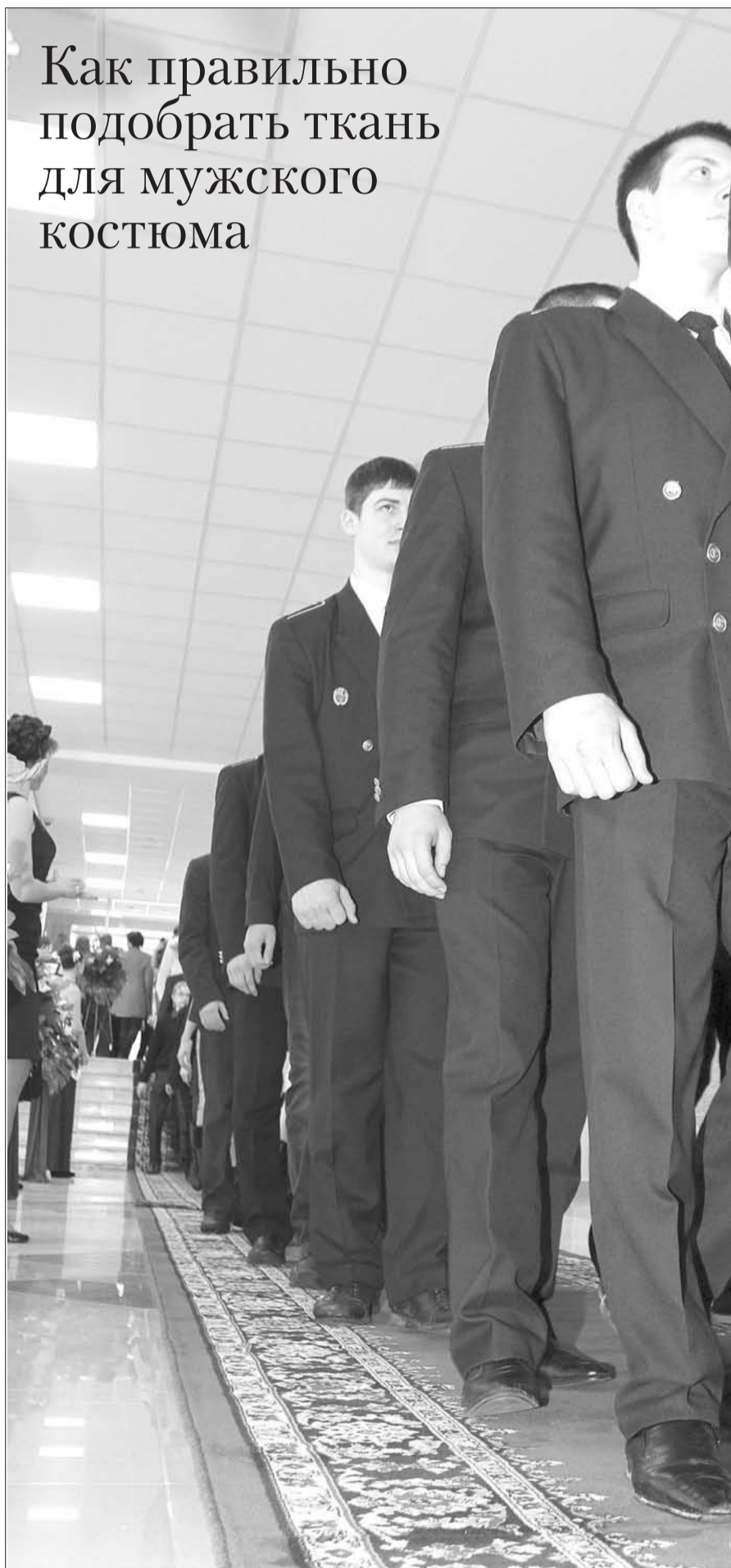
Образ бравого летчика немислим без формы