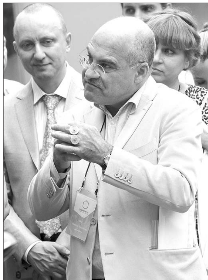
Если журналист в костюме, его трудно отличить от министра