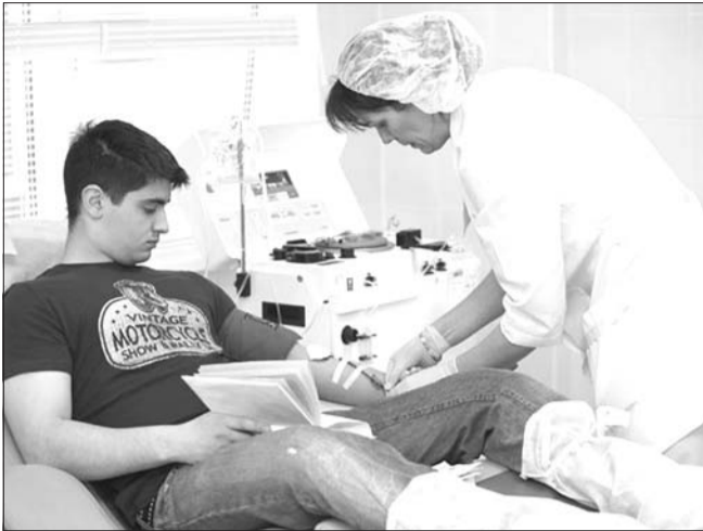
↑ Вчера, 19 сентября, на базе региональной станции переливания крови прошла акция «День молодых доноров». В этот день масштабные мероприятия в поддержку донорства прошли не только по всей России, но и в Азербайджане, Киргизии, Белоруссии, на Украине и во Франции.