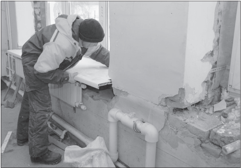
В администрации Ульяновска было решено завершить в следующем году строительство детсада № 258 на улице Репина

Чем больше инициатив Послания Президента России мы сможем реализовать, тем больше благоустроенным и успешным будет наш родной Ульяновск.