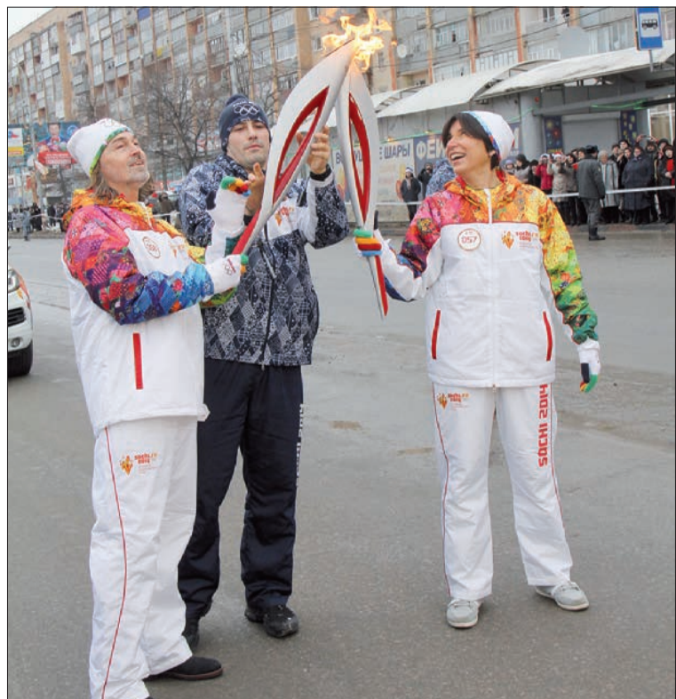
Звезды на ульяновской эстафете: Никас Сафронов и Ирада Зейналова.

— Мой жизненный принцип — стараться изменить мир к лучшему. Для меня большая честь и гордость пронести главный символ Олимпиады. С ранних лет занимаюсь спортом, восемь лет играл в футбольной команде, веду активный образ жизни. Хотя профессиональным спортсменом не стал, я смогу внести свой вклад в историю Олимпийских игр.