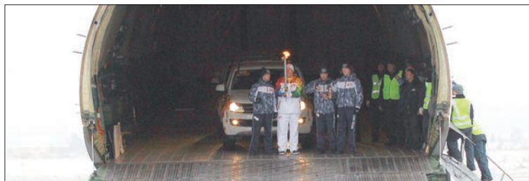
Огонь вместе с эскортом приземлился на «Руслане» мягко.

— Полет длился порядка 20 минут, и, к счастью, сбоев никаких