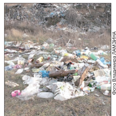
Стихийные свалки здесь повсюду.

– У нас в поселке с клубом постоянные проблемы. Для старшего поколения и молодежи нет хорошей развлекательной программы. Им дают ключи от РДК, и молодые люди там творят что хотят: распивают спиртное, курят, устраивают стычки между собой. Жители села давно выступают против завклубом, но эта проблема пока также никак не решается, – отметила би-