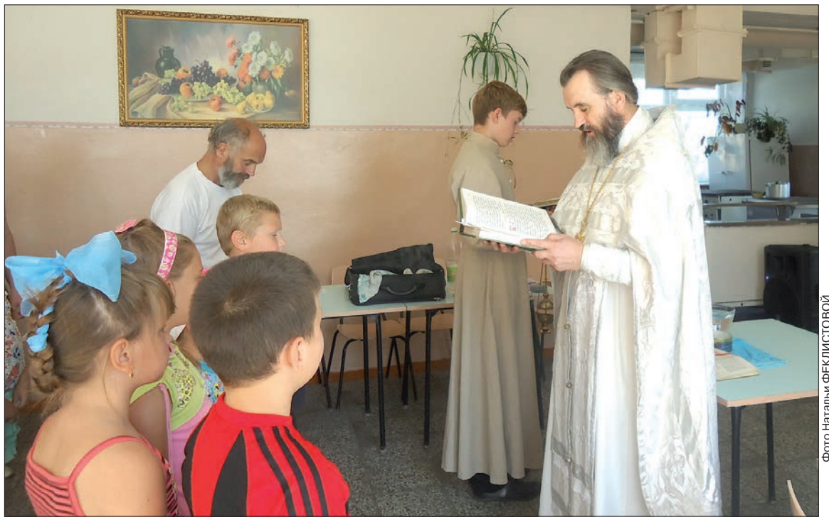
Учащиеся внимательно слушают батюшку.