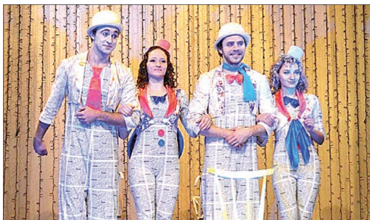
Артисты Enfant Terrible перед такой публикой впервые.

«Слон Хортен» по произведению американского писателя Доктора Сьюзи произвела на всех присутствующих в зале незабываемое впечатление. Сюжет спектакля, построенный на размышлении о добре, ответственности за своих близких и других человеческих ценностях, был умело раскрыт профессиональной игрой актеров. Настоящим подарком для осужденных