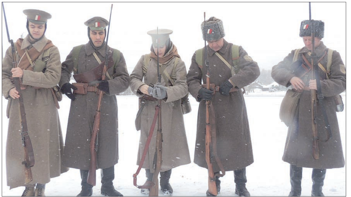
Чердаклинцы восстановили эпоху до мельчайших деталей.

Мероприятие открыли молебен и митинг, посвященный 95-летию событий Гражданской войны в селе. На здании вокзала, того самого, где располагался штаб легендарного белого генерала, была установлена памятная табличка с текстом: «...Здесь дрались свои: брат на брата, отец на сына, кум на кума, значит, без страха и беспощадно. Ни летописей, ни военных архивов не осталось от этой великой войны в самарских и симбирских степях...» (так описывал период