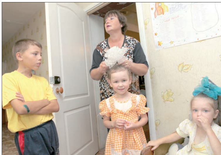
«Орбита» стала домом для ребятшек.

История Майнского детдома отражает историю нашей страны. Когда грянула Великая Отечественная война, возросло число мальчишек и девчонок, потеряв-