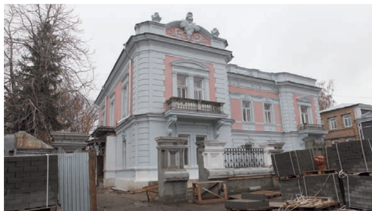
Музей современного искусства скоро будет не узнать.

По ходу осмотра обсудили важную тему: в Ульяновске еще немало учреждений культуры, нуждающихся в ремонте, – здания филармонии, областной детской школы искусств, дворцов культуры УАЗ, «Строитель» и имени 1 Мая, областной архив – здание на ул. 12 Сентября (почти готова проектно-сметная документация на ремонт архива, планируется начать его в следующем году). Сергей Морозов отметил, что можно и нужно ремонтировать учреждения культуры с использованием механизмов частно-государственного партнерства.