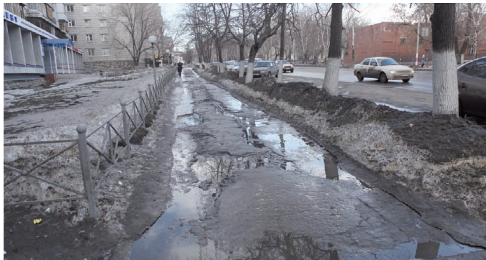
И как можно пройти по такой улице?

но! Особенно по стороне, где находится целый ряд медицинских учреждений. Здесь иногда такие потоки воды, что некоторые горные речки позавидуют! И подобная картина уже не первый год. А сколько таких еще в Ульяновске!