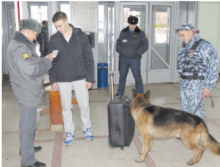
Даже в свой праздник на работе.

– Если анализировать виды преступлений, то чаще всего транспортным полицейским приходится заниматься пресечением фактов незаконного оборота и сбыта наркотиков. За 9 месяцев 2014 года сотрудниками Ульяновского ЛО МВД России на транспорте изъято из незаконного оборота 3 килограмма 822