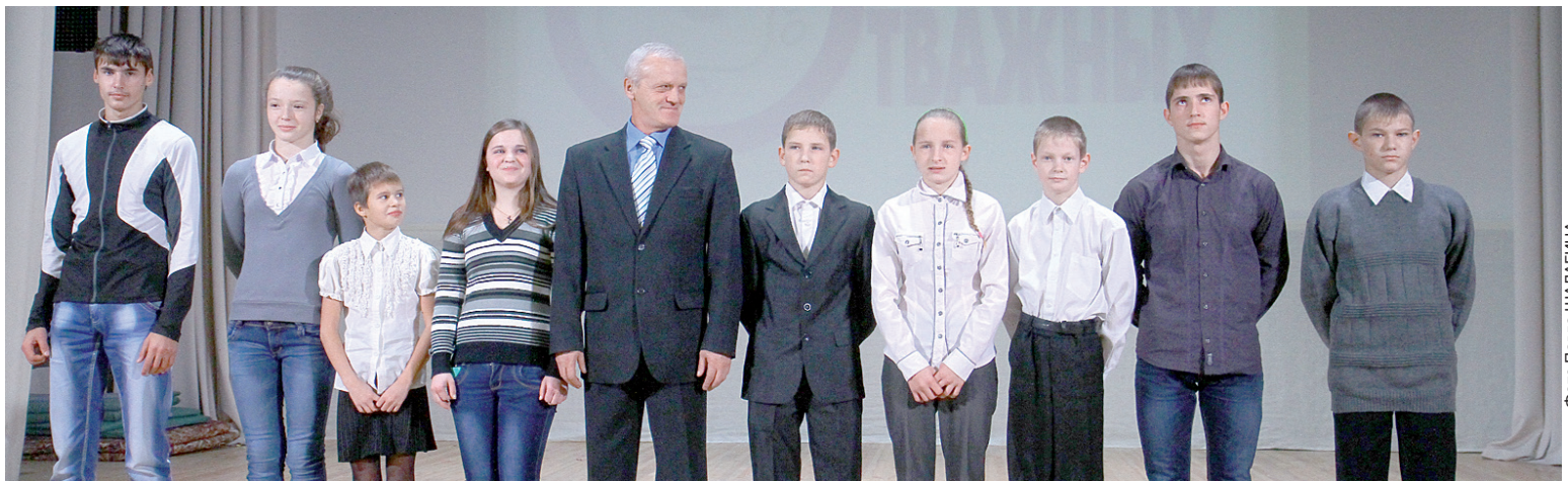
Участникам «Острова отважных» вручили значки первого взрослого разряда.