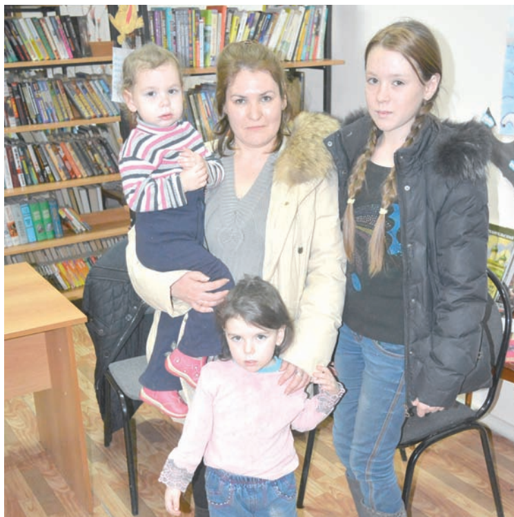
Большую семью ждет новый дом!

Совсем недавно в поселке Цемзавод Сенгилеевского района уже была отремонтирована баня, приведено в порядок освещение, убран мусор... Пришло время переселиться! Два новых трехэтажных дома – общей пло-