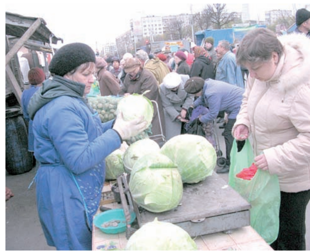
Ярмарки пользуются популярностью.

В завершение ярмарки были выбраны и награждены победители по четырем номинациям. «Лучшим фермером» в итоге определено личное подсобное хозяйство