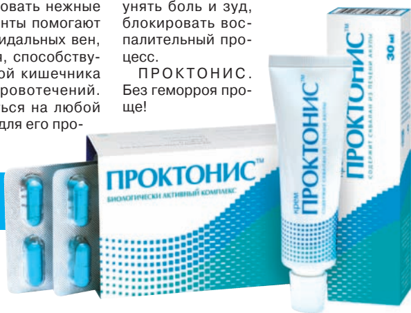
РЕКЛАМА. БАД. Перед применением проконсультируйтесь со специалистом.