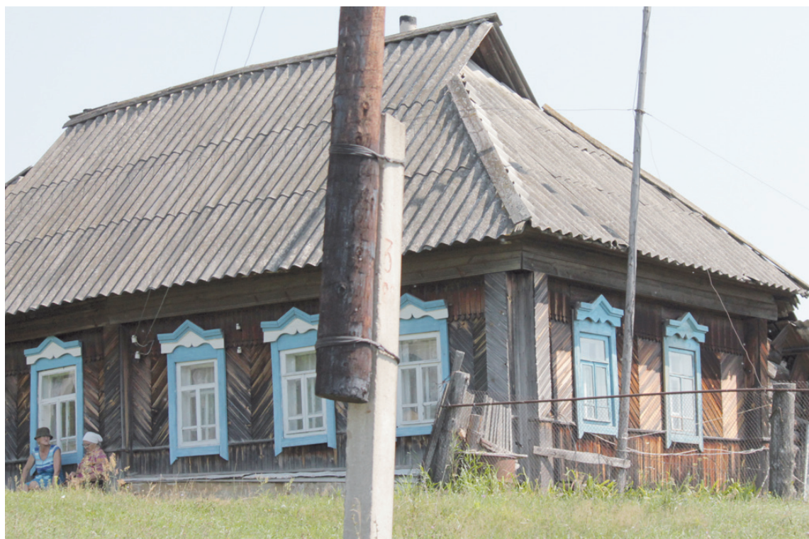
Работы для того, чтобы сельские территории комплексно развивались, хватит всем.