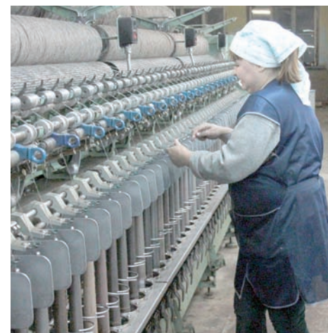
Сделать сукно на шинели не проблема.

Единственной загвоздкой являются мелкие детали обмундирования. Учитывая, что это будет реконструкция формы времен Великой Отечественной войны, то кроме самих шинелей нужны будут разного рода знаки отличия, пуговицы, кокарды, петлицы. В общем, не самые заметные, но все же обязательные элементы военной формы.