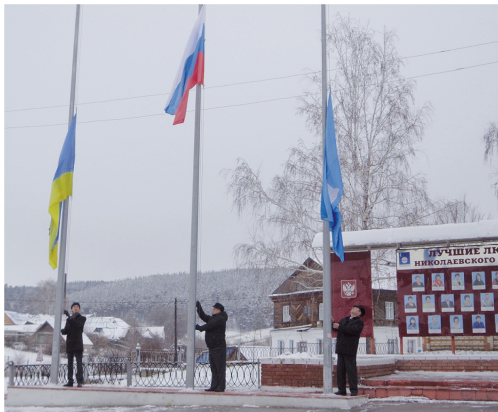
Флаги поднимали достойные.