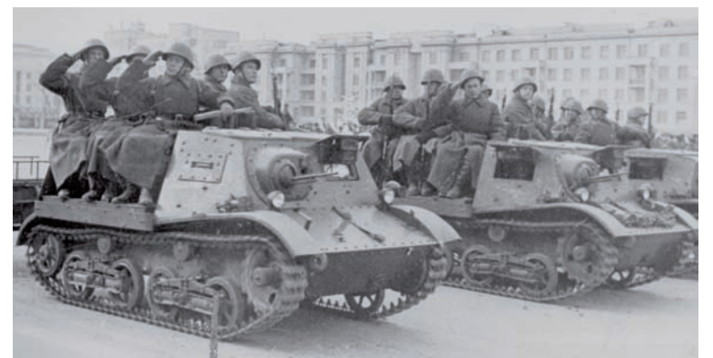
По «запасной столице» шла новая техника.

Парад в Воронеже был менее масштабным, чем в Куйбышеве. Однако у него было сходство с московским. Так же, как и в столице, солдаты, прошедшие по воронежской площади 20-летия Октября, сразу уходили на фронт. Бои в это время шли буквально в 150 километрах от города. Здесь не было авиационных парадов,