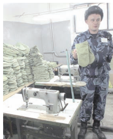
Вот такие рукавицы шьют заключенные.

Люди есть разные, но даже самых, казалось бы, пропавших чаще всего тюрьма исправляет. Вот один из наглядных приме-