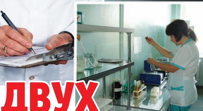
Коллаж: Юлия МАСЛИХОВОЙ