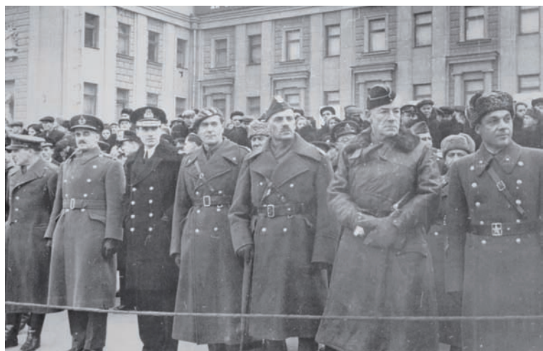
На параде в Куйбышеве были и иностранные дипломаты.

В Ульяновске, как и в большинстве других городов, в тот день парада не было. К тому же, как уже сказано выше, наш город тогда был районным центром. Но праздничные мероприятия, несмотря на войну, прошли. В здании драмтеатра прошло заседание исполкома горсовета. На площади Ленина состоялась праздничная демонстрация, которую приветствовало партийное и комсомольское руководство. А потом ульяновцы смогли пойти в кино на премьеру фильма «Дело Артамонова» или в музей Ленина, где ради праздника было увеличено число экскурсоводов.