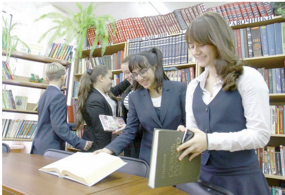
Кто много читает, тот много знает.