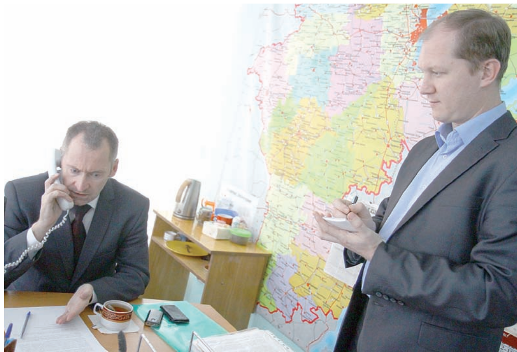
Вопросы читателей решались сразу же на месте.

В соответствии с заключенным контрактом оператор организует питание учащихся