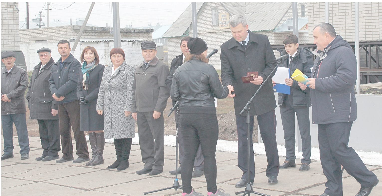
Самые юные участники праздника получили паспорта.