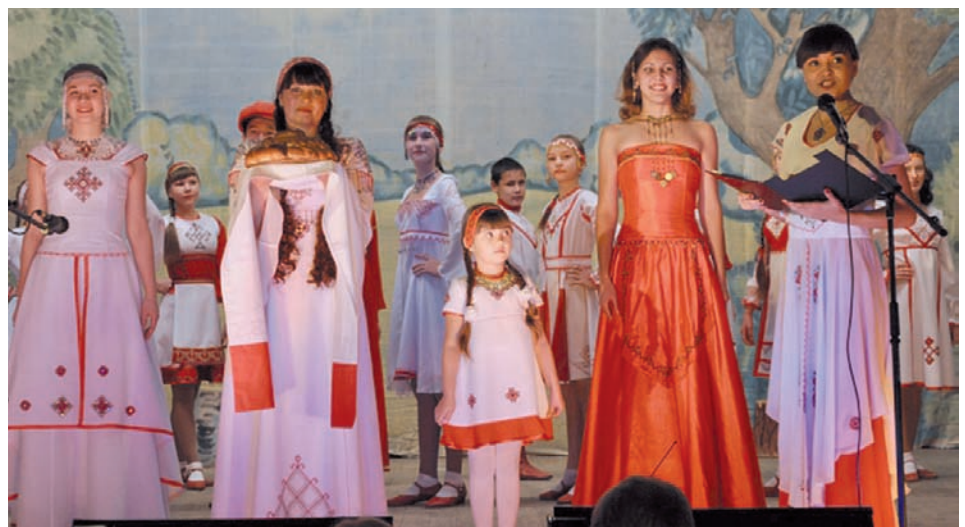
Участники воспевают традиции чувашского народа.

Эксперты после бурных обсуждений определили победителей в следующих номинациях: «Хореографический жанр»