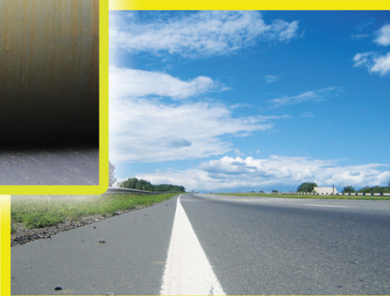
Коллаж Юлии МАСЛИХОВОЙ

миллионов рублей с условием расчета в 2016 году. За счет этих средств в первую очередь приведут в порядок участки дорог Барыш – Инза – Карсун (Барыш –