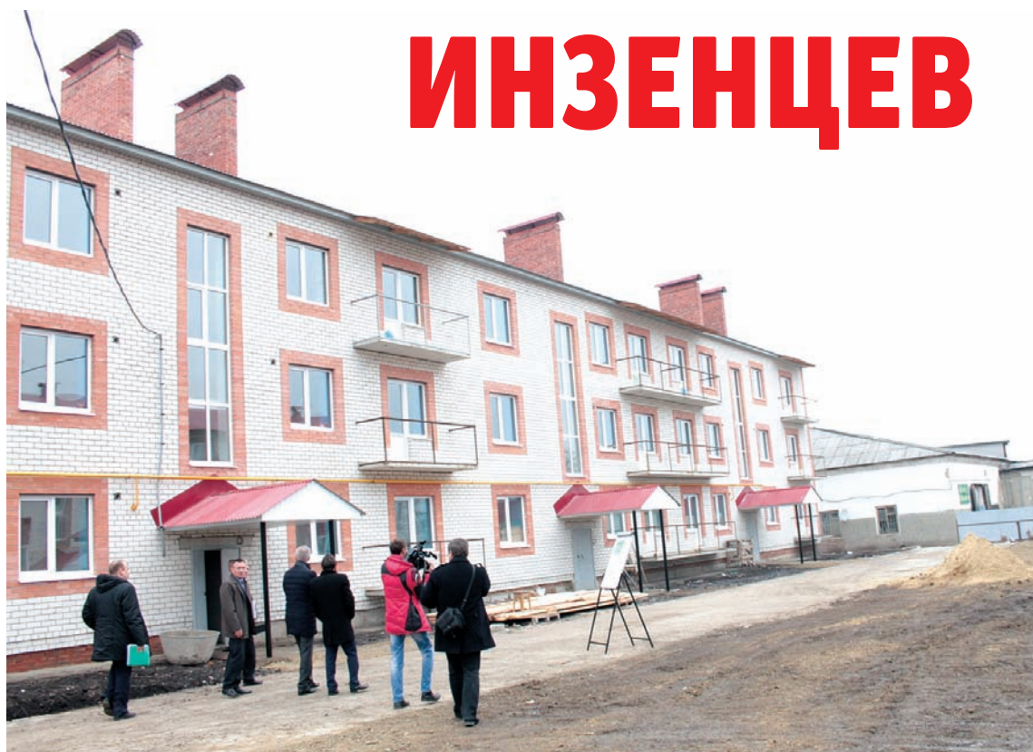
Горожан переселяют в такие красивые дома.

своим домом. Всего же для нужд сирот в Инзе было закуплено 37 квартир в двух микрорайонах города. И до конца ноября владельцам будут переданы ключи.