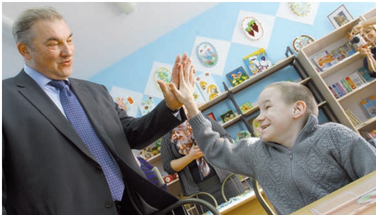
Третьяку ребята подарили три картины – на долгую память!

За счет постоянной помощи неравнодушных и государственного финансирования этот детский дом выглядит просто превосходно, тем не менее депутат пообещал сделать «Роднику» еще один подарок – закупить второй тренажер для детей на «лежачем» режиме.