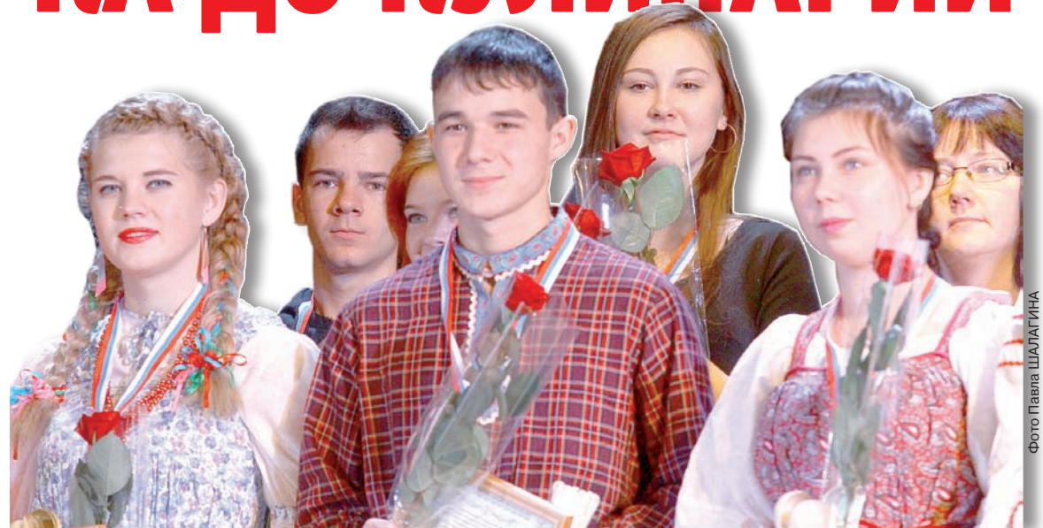
Победители примут участие в федеральном этапе Игр.

Новые номинации позапрошлого года – фотоискусство и тележурналистика, похоже, наконец-то заняли свою нишу. В «Тележурналистике», например, развернулась настоящая дуэль между воспитанницами пресс-центра Железнодорожного района «Норд-Вест» и группой факультета журналистики