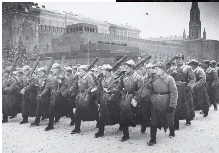
Парад в Москве поднял боевой дух солдат.

Во время парада были приняты беспрецедентные меры по обеспечению безопасности советского руководства – у