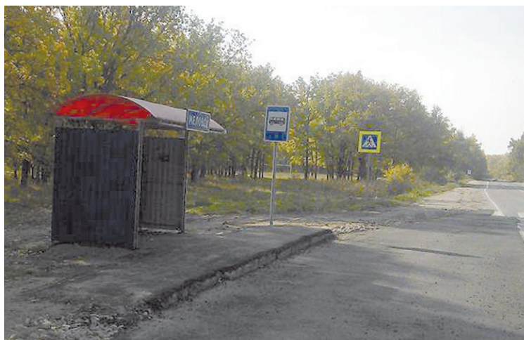
Год спустя остановка у поселка Меловой была отремонтирована.

И вот через некоторое время эту самую яму заасфальтировали. Вроде бы хорошо, мы добились от властей каких-то действий. Но, по словам того жителя, который нам прислал фото уличных безобразий, на самих улицах ничего не изме-