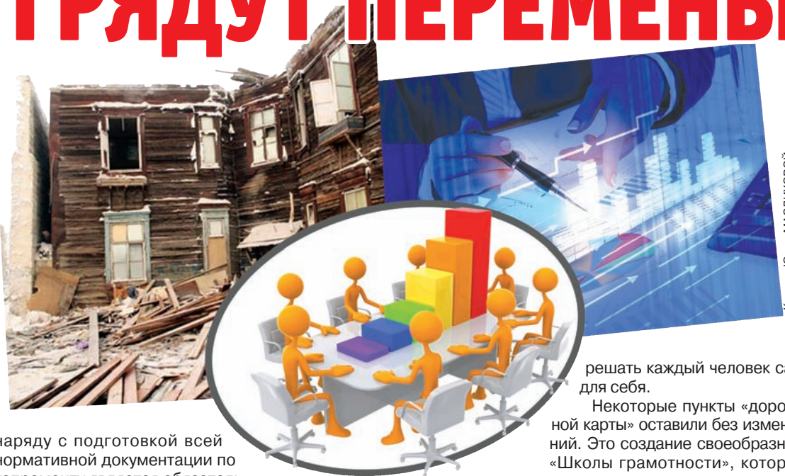
Коллаж Юлии МАСЛИКОВОЙ

Утверждение этих комплексных мер до конца 2014 года