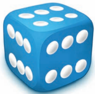
Standards Level The Playing Field

14 октября – Всемирный день стандартов. Именно в этот день в 1946 году в Лондоне в помещении Института гражданских инженеров открылась конференция национальных организаций по стандартизации. 25 стран, включая СССР, были представлены 65 делегатами. Результатом их работы стало учреждение новой Международной организации по стандартизации – ISO (от греческого слова isos – равный).