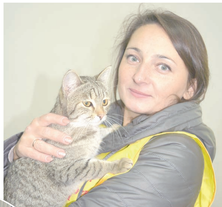
У каждого животного своя непростая судьба.

щаются 10 собак и 20 кошек. Больше пока фонд позволить себе не может. Условия для животных созданы просто отличные. У каждой собаки свой вольер, выгуливаются все они в одном общем вольере на улице. Кормят питомцев три раза в день.