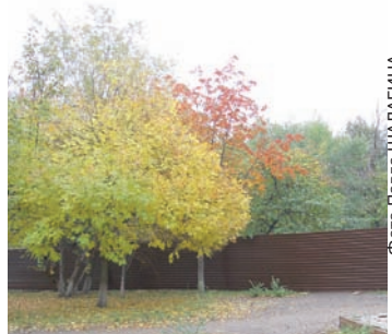
Заборы скоро должны убрать.

Меж тем экологическая палата направила в администрацию Ульяновска рекомендацию о выделении застройщикам, отказавшимся от строительства, новых участков, на которых они смогли бы реализовать свои проекты.