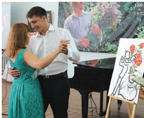
Молодожены дали клятву верности друг другу.

На праздник под символическим названием «Свадебный вальс» пригласили как холостя-