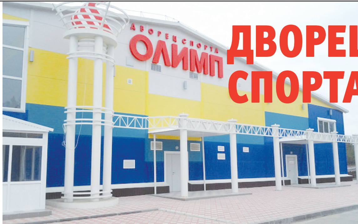
«Олимп» – один из лучших в Поволжье.

Сотрудники правительства Ульяновской области посетили Радищевский район с проверкой на выезде. В результате были выявлены несерьезные нарушения норм законодательства, правил юридической техники, а также принципов ведения документов. Сейчас администрация муниципального образования ведет работу над устранением нарушений.