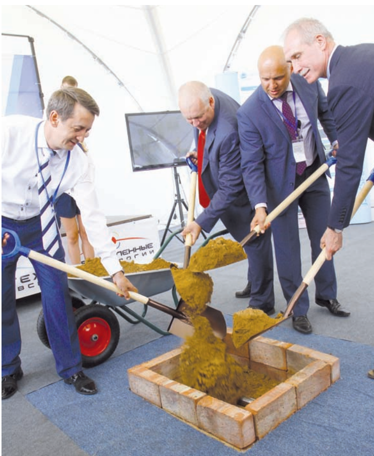
Стартовать всегда приятно.

– Одним из направлений государственной поддержки развития профобразования является развитие региональных систем профессионального образования. Приятно отметить, что Ульяновская область является победителем конкурсного отбора региональных программ, одна из которых ориентирована на подготовку кадров для авиационной