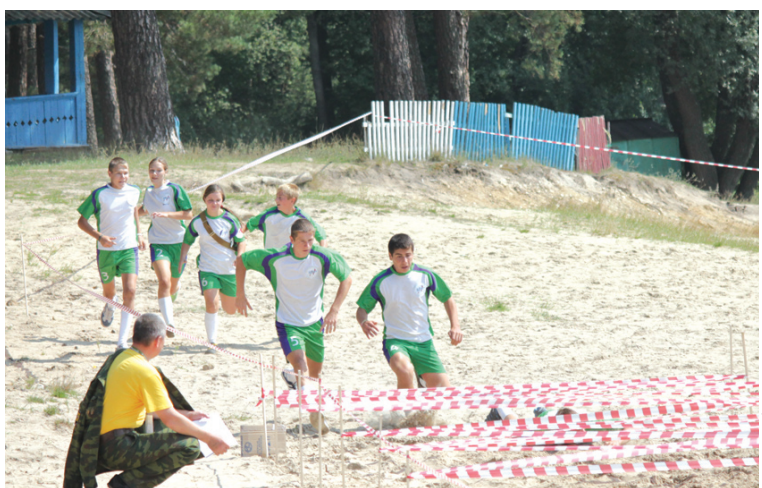
Хотя ребята и заверяли, что нужно быть лишь быстрыми, на деле им требовалась еще ловкость и меткость.

ровальную машину. На третьем месте расположилась одна из команд базарносызганского «Ростка», которая увезет из Юлова набор книг. Не остались без призов и победители в индивидуальных номинациях, получившие в подарок обычные и роликовые коньки, надувные матрасы и многое другое.