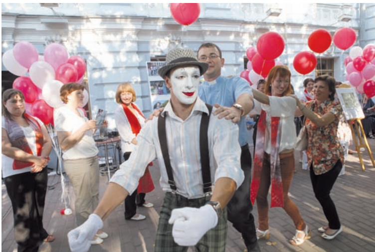
Для гостей юбилея Шодэ выступил мим.

Ко дню рождения знаменитого симбирянина община подготовила органнй концерт. Исполнялись композиции Баха, Брамса и других классиков. Талант архитектора – вплоть до мелочей: органная музыка благодаря особенной акустике кирхи звучала буквально отовсюду.