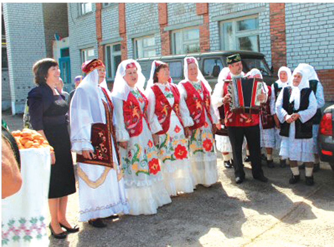
Пожилые – значит активные и творческие!

Они высоко оценили творческие выступления участников конкурса, выставку прикладного творчества и пожелали конкурсантам дальнейших творческих успехов и процветания.