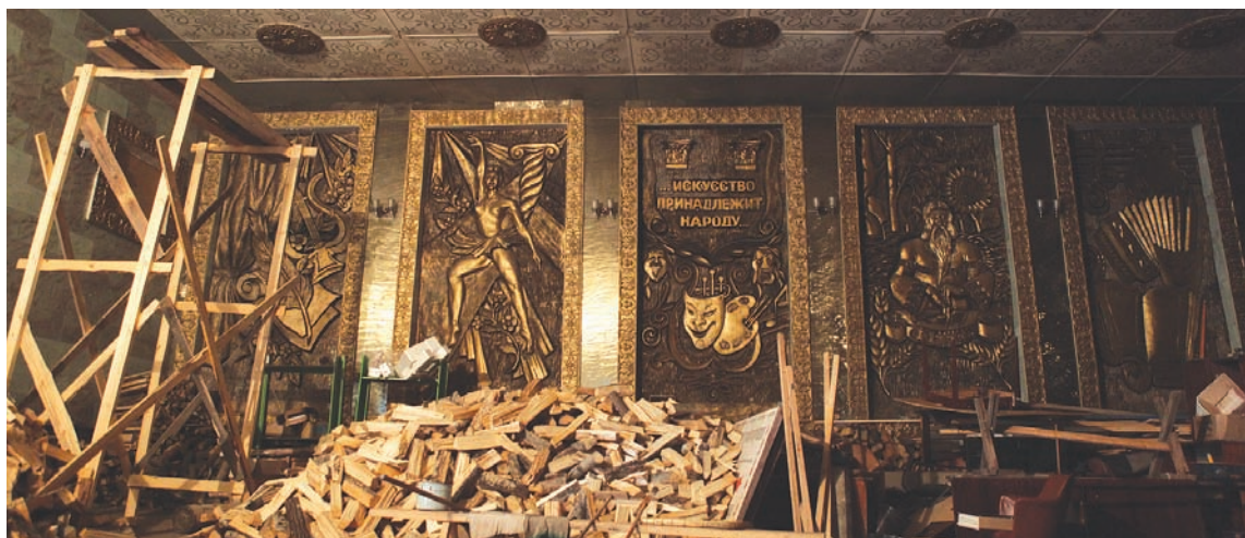
Сельский Дом культуры требует ремонта.

По преданиям на месте села когда-то располагалась большая конная рать, а по дороге, проходящей сквозь деревню, ездил в свое имение знаменитый русский поэт Александр Пушкин. Добрые и отзывчивые сельчане не скушают в далеком от города месте. Допытаться, какие в Большой Кандарати проблемы, было не так просто.