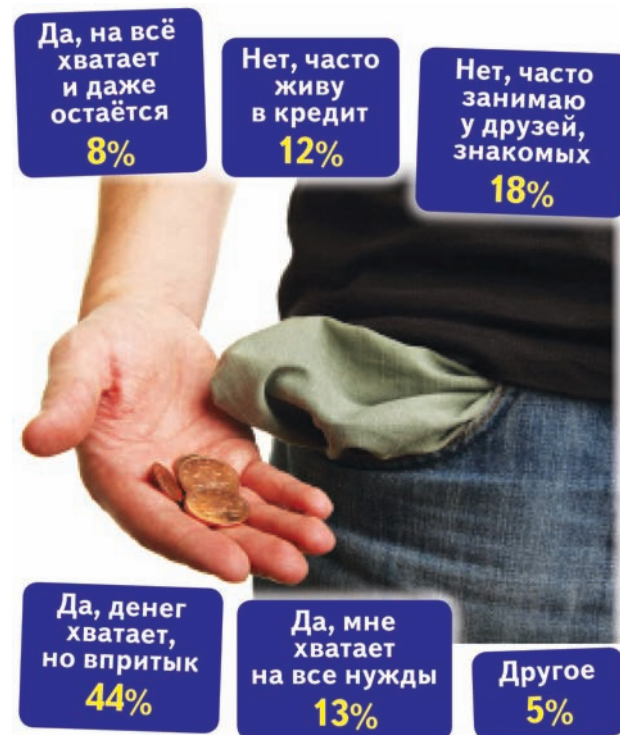
Инфографика Юлии МАСЛИХОВОЙ. По данным sotsopros.ru

Судя по ответам россиян на вопрос, живут ли они по своим средствам, почти половина из них тянет свое существование от зарплаты до зарплаты. Конечно, понятия «хватает» и «впритык» у каждого свои, тем не менее количество тех, кто вынужден часто брать кредиты и занимать у друзей, не может не настораживать. Как говорится, рад бы жить по средствам, да денег не хватает!