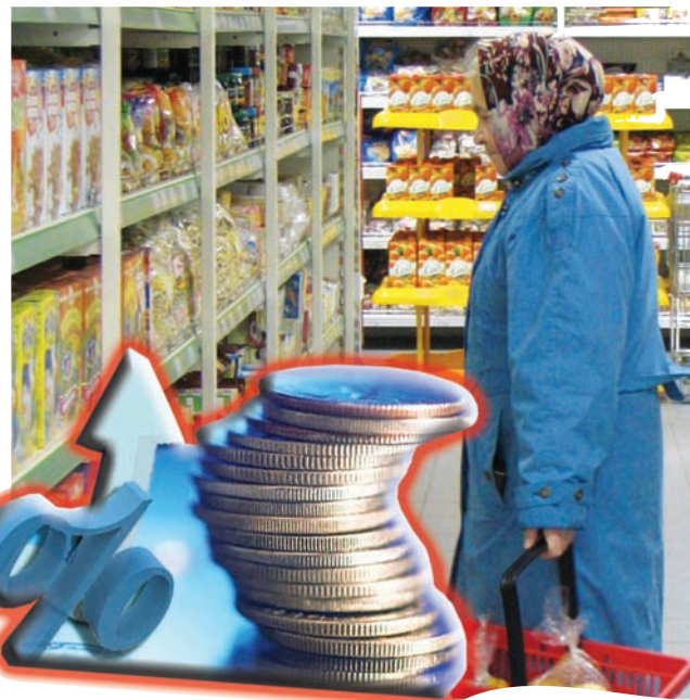
Коллаж Юлии МАСЛИХОВОЙ

Тем не менее внешняя и внутренняя политика России сейчас складывается так, что нам надо уповать на себя самих. Вот и Сергей Морозов на аппаратном совещании коснулся важной темы импортозамещения.