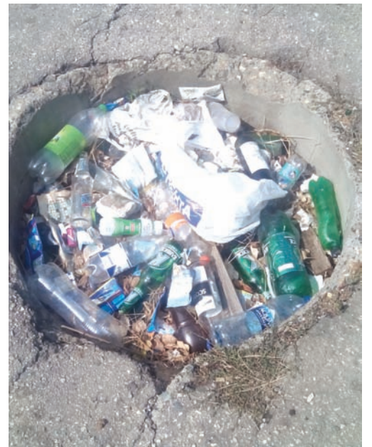
Лежит и пахнет... из года в год.

? Почему системно происходит такое безобразие на центральных улицах Нового города Ульяновска? Почему в семейном парке грязно? Кто должен убирать эти улицы и парк «Прибрежный»? Кто ответственный за данное нарушение всех норм и правил? Почему никто не несет реальной ответственности за неуборку мусора с улиц города?