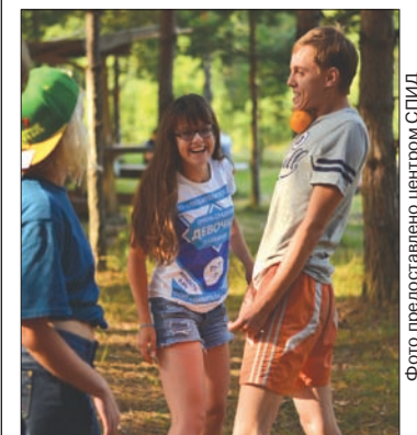
На «мобилку» съехались более 200 человек.

В этом году активисты собрались уже в 10-й раз. На «мобилку» – так ласково называют участники мероприятия – съехало более 200 человек из 12 муниципалитетов региона. Кроме того, чтобы обменяться опытом, на берега Юловского пруда впервые приехали волонтеры из Башкортостана.