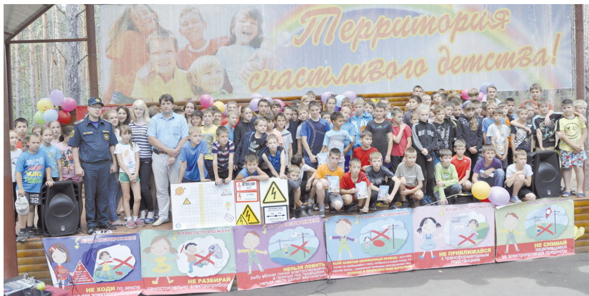
Правила электробезопасности легче запоминаются с помощью ярких плакатов.

Любимая игра повеселила не только участников команд, но и зрителей.