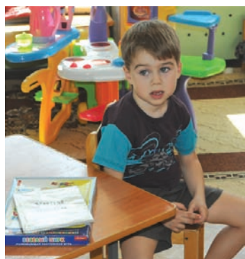
Скоро в детсады отправятся еще 40 юных кузоватовцев.

Полностью закрыть потребность районов в садах помогли две новые дошкольные группы полного пребывания. Расположились они в селах Волинщина и Еделево.