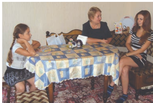
Министр финансов в гостях у девочек-учениц.

– С 1 июня около 13 тысяч ульяновских детей уже получили необходимую поддержку в подготовке к новому учебному году на сумму более 22,5 миллиона рублей, около 16 тысяч школьников обеспечены бесплатным пита-