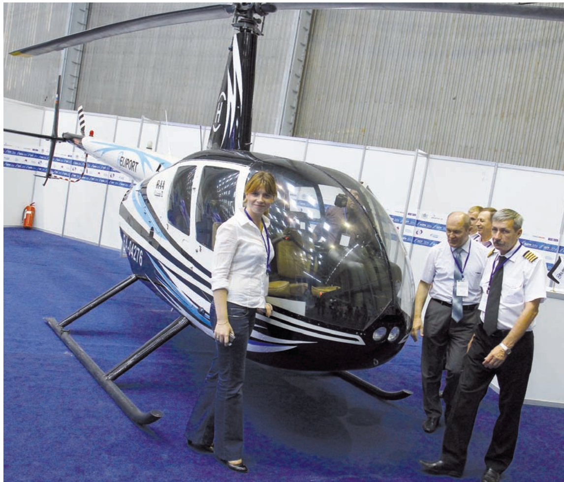
Новый городской транспорт ближайшего будущего.

Меня всегда удивляли «юмористы», подкалывающие наш регион и областную столицу по поводу авиационной столицы. По их понятию, все должно было произойти сразу и на мировом уровне. То, что авиационная промышленность – это одно из самых сложных производств, они не задумывались. И нужны годы кропотливой работы, чтобы поставить все на ноги. И, поверьте, наша область встала на ноги, или в данном случае на шасси, на крыло, если хотите. Ожил и заработал «Авиастар», у нас уже два международных аэропорта, втягиваются в авиапромышленную кооперацию все новые и новые предприятия. Регион постепенно формируется как центр российского транспортного авиастроения. Что, кстати, и стало девизом очередного, уже III Международного авиатранспортного форума (МАТФ), который прошел в конце прошлой недели в Ульяновске в районе аэропорта «Ульяновск-Восточный».