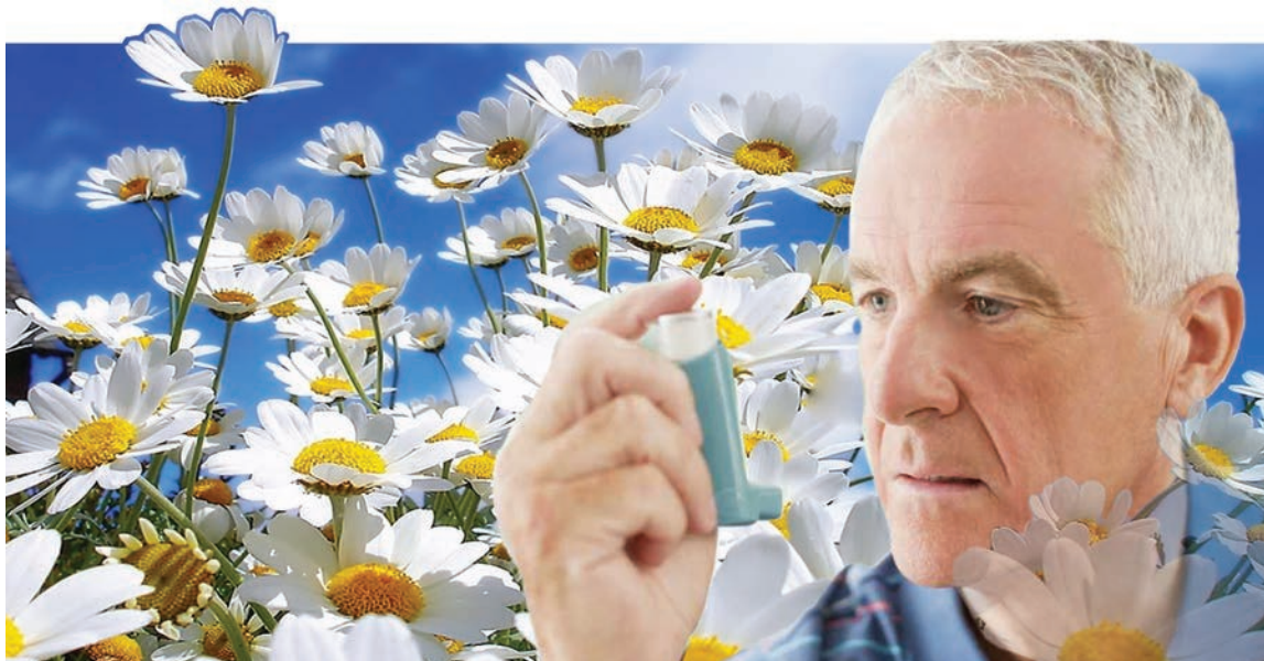
Коллаж Юлии МАСЛАНОВОЙ

Продукты питания, содержащие консерванты, красители,