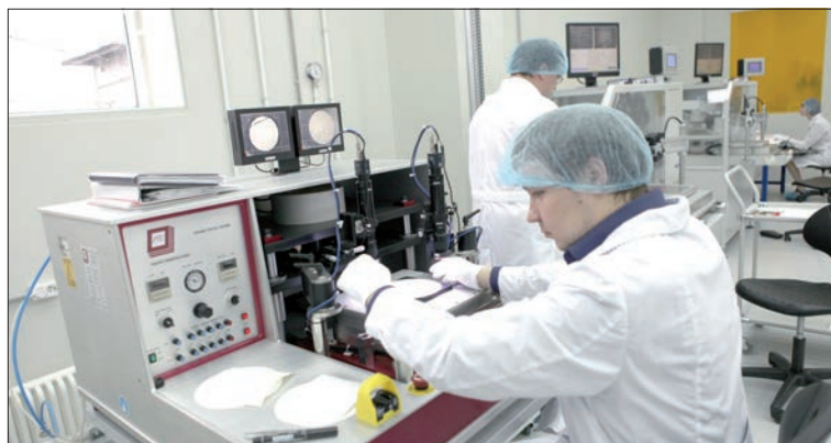
«Искра» занимается новыми технологиями, чтобы расширить производство.

В мае 2014 года проект закона должен быть представлен в правительство, в июне – в Госдуму. Вступит в силу в середине 2015 года, а реально начнет действовать с середины 2016-го.