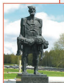
Мемориальный комплекс «Хатынь»