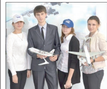
Ребятам со школы прививают любовь к авиационной.

В октябре 2013 года Карсунская средняя общеобразовательная школа стала четвертым действующим центром профессиональной ориентации школьников по авиационному направлению в нашем регионе. Своей деятельностью он охватил все западные районы области. Центр профориентации по авиационному направлению – это еженедельные занятия по 3D-моделированию, экскурсии и знакомство с региональным авиационным направлением, проведение анкетирования и многое другое. Целью профориентационных занятий со школьниками является повышение их интереса к авиационной тематике, стимулирование их исследовательской и творческой активности.