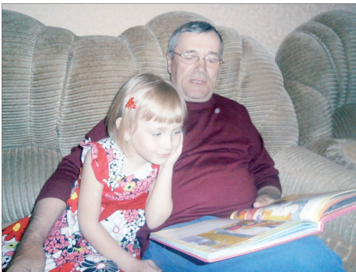
Дедушка, почитай мне сказку!

Осмелюсь предположить, что развить «осознанное стремление к чтению» с помощью этих авторов будет чрезвычайно сложно. Не потому, что они неинтересны. Они интересны для людей с развитым литературным вкусом и опытом. А для современного читателя, особенно молодого,