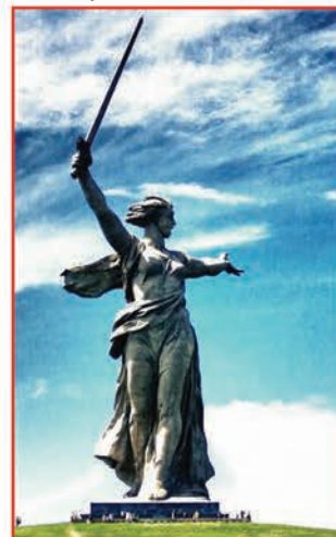
Скульптура «Родина-мать зовёт!»

Все дальше от нас фронтовые сороковые, и для нынешнего поколения Великая Отечественная война – это событие далекого прошлого. Но мы не имеем права забывать о ней. О трагизме победы над фашизмом, о цене, которую заплатил наш народ, нам напоминают памятники, увековечившие Великий подвиг.