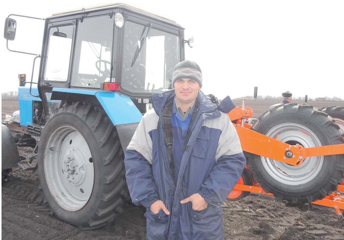
На помощь человеку приходит новая сельхозтехника с современными технологиями.

В строительстве картофелехранилищ будет вложено более