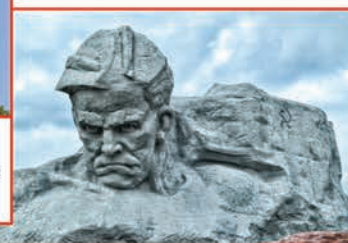
Мемориальный комплекс «Брестская крепость-герой»