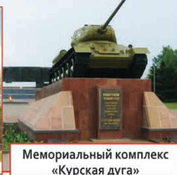
Мемориальный комплекс «Курская дуга»