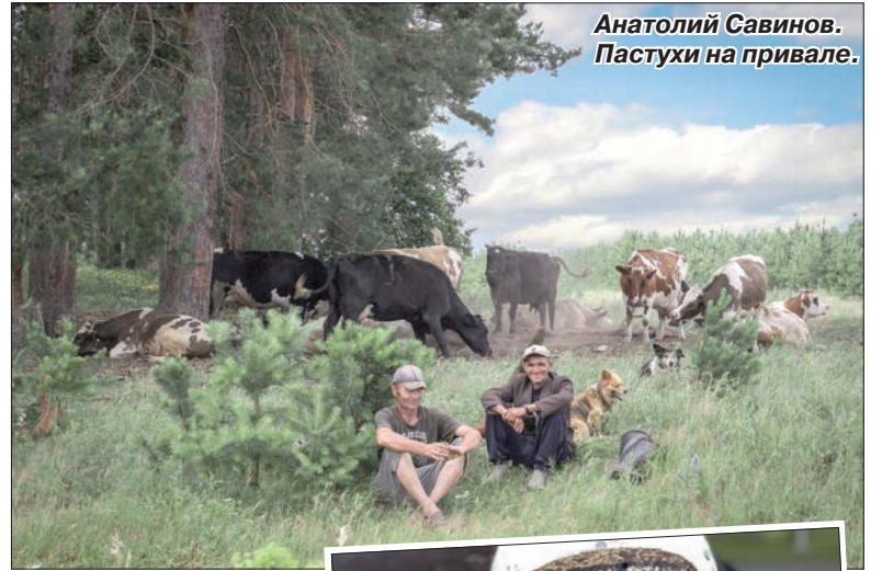
Анатолий Савинов. Пастухи на привале.