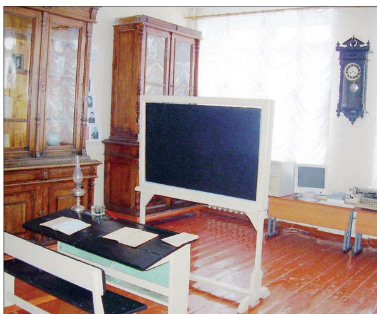
Музей – неотъемлемая часть общешкольного организма.

вестник» от 18 февраля 2011 года опубликована статья Волинцева под названием «Начальное и среднее образование в Карсуне». Заметка, которая хранит многовековую память просветительской деятельности в районе, в свою очередь бережно оберегается музеем школы.