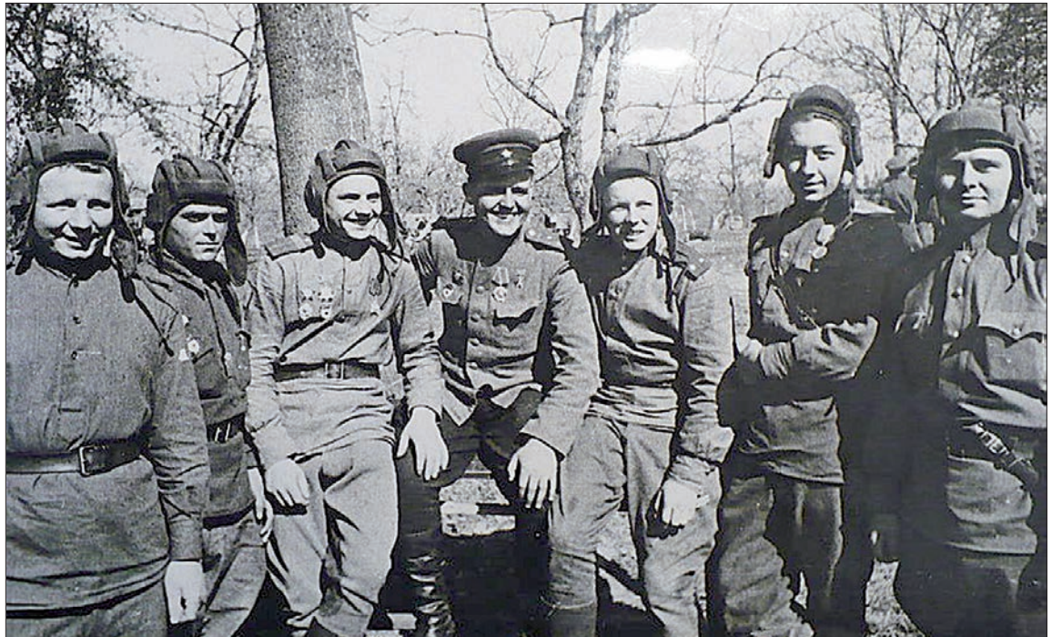
Имя героя носит улица в Ульяновске, а о его славной жизни можно узнать из его фронтовых писем.