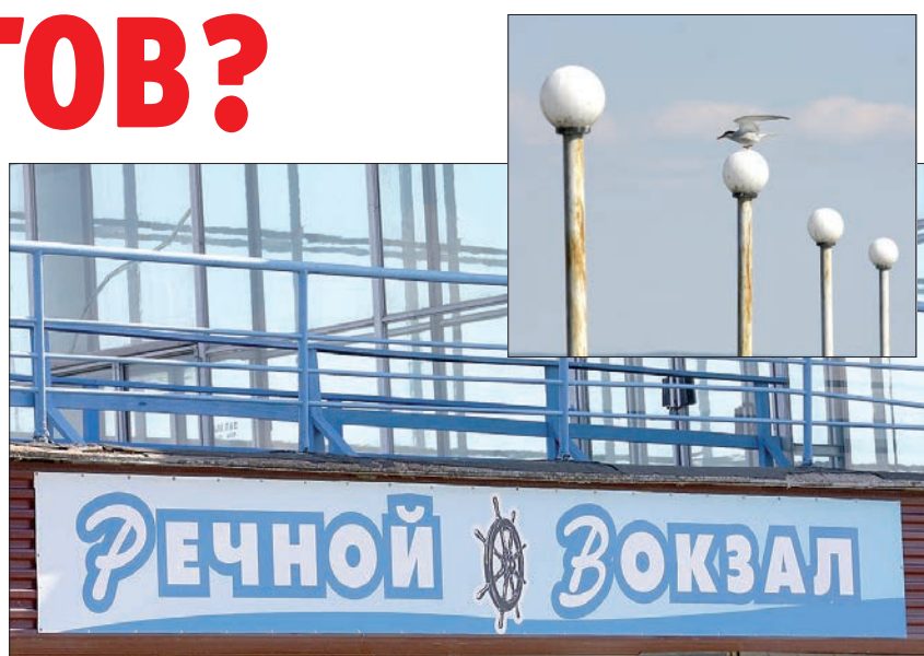
Зеленая тоска встречает гостей региона.

Что видят туристы, приплывающие в Ульяновскую область на теплоходах? Затерянный в просторстве речной порт Ульяновска, откуда и местные жители не всегда знают, как добраться до центра города. Даже если приедем удастся попасть в город – что они там могут увидеть? Какие экскурсии подготовлены для туристов? На этот вопрос губернатора Сергея Морозова, заданный на очередном аппаратном совещании, так и не был получен ответ.