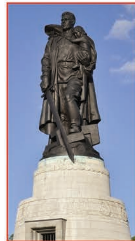
Монумент «Воин-освободитель» в Берлине