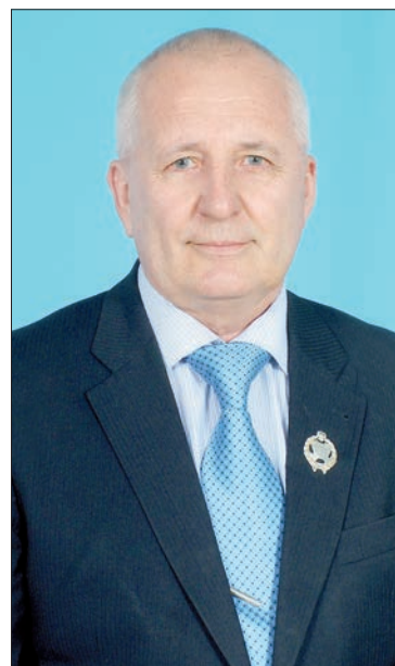
1-й категории АООТ «Строитель».