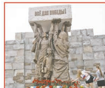
Памятник труженникам тыла в Тюмени