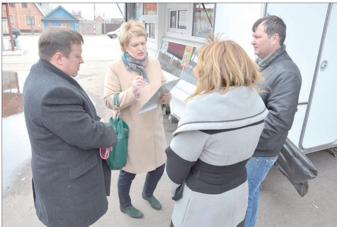
Нарекания у участников рейда есть, но они, как правило, решаются оперативно.

– Ее девочка тут недавно играла в луже. Мы запретили ей это делать, заботясь о том, чтобы не простудилась. А она взяла и нажаловалась маме, которая пришла защищать свое чадо и устроила нам скандал. Больше никаких конфликтов за то время, что здесь работаем, ни с кем не было. И конкурентов в округе у нас нет, чтобы таким образом неприятности создавать, – объясняют продавцы.