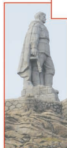
Памятник «Алеша» в Пловдиве