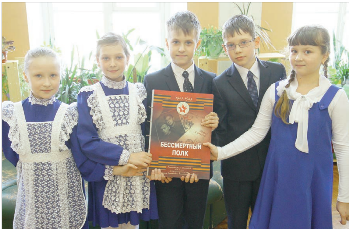
Каждый класс изготавливает альбомы о своих солдатах.