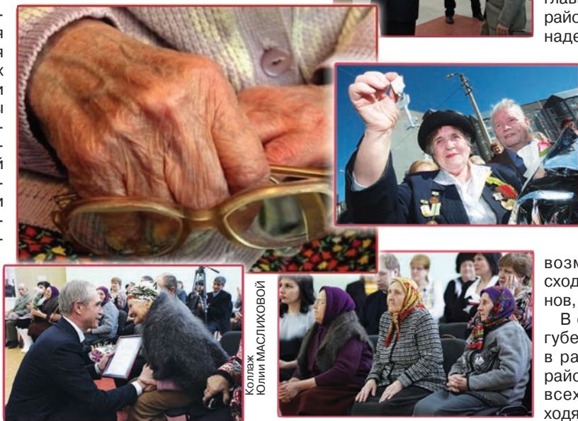
Коллаж Юлии Масликовой

Главное же, чтобы и после праздника мы помнили всех, заботились о каждом. Ветераны это заслужили.