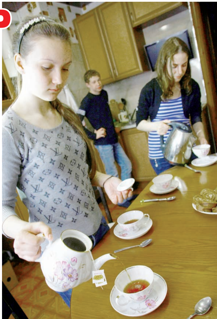
Проблем с готовкой нет, труднее выбрать продукты.