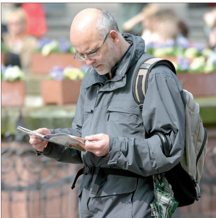
Для законного пребывания в России необходимо встать на миграционный учет.

Адрес УФМС России по Ульяновской области: г. Ульяновск, площадь Горького, 7, телефон 8 (8422) 39-90-86.