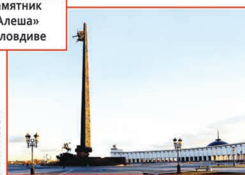
Поклонная гора в Москве