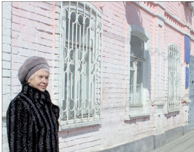
У дома, где прошло военное детство.