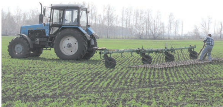
В поле земледельцы заправляли посевной комплекс сложными удобрениями.

Первым по маршруту следования оказалось ООО «Нива».