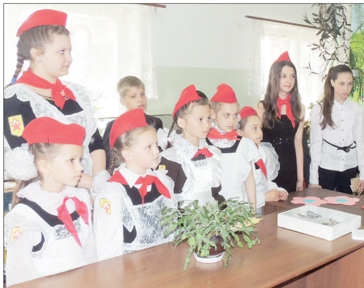
Рядом с младшеклассниками старшие наставники.

Взрослым в этот день тоже пришлось поволноваться. Старшие вожатые и классные руководители младших школьников представили методический материал по итогам учебного года. Оценивали работы педагогов ветераны педагогического труда Чердаклинского района.