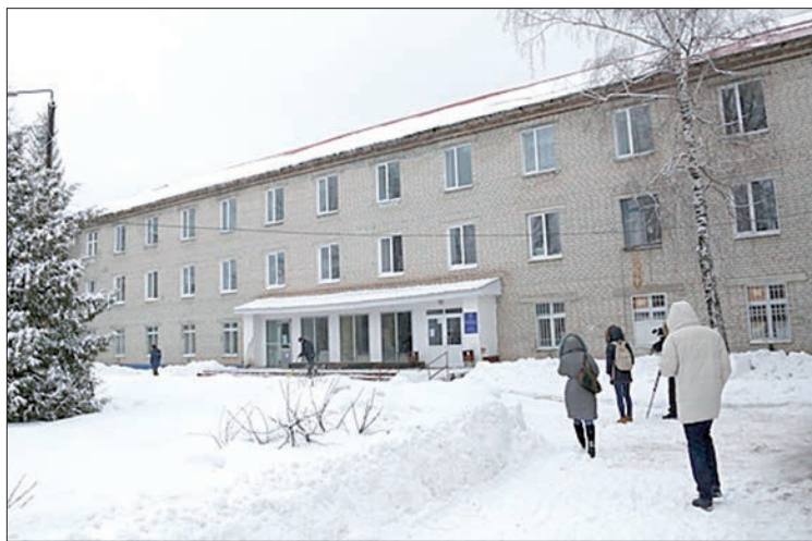
Сегодня частично или полностью все лечебные учреждения требуют ремонта.

Для комфортной жизни детей областные и районные власти уделяют внимание не только школам, но и спортивным сооружениям. В районе продолжается реконструкция зданий крупных районных спортивных объектов. Вслед за Майнским спортком-