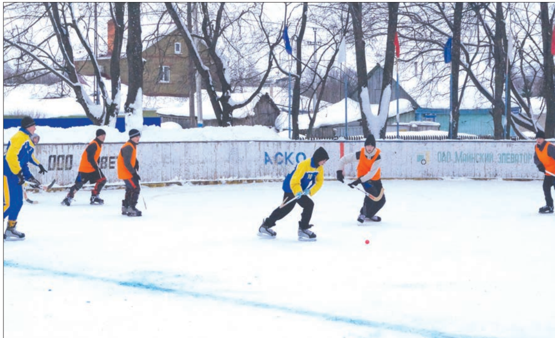
«Росток» – «Надежда» – 7:0.

ревнований был проведен товарищеский матч благотворителей, в котором сыграли люди, помогающие проводить этот хоккейный турнир, и команда ребят из Майнского детского дома. Среди благотворителей было и руководство регионального общества «Динамо», и Ульяновской федерации хоккея с мячом, и местные энтузиасты, которые всю ночь чистили, варили лед при нулевой температуре воздуха и больших осадках – все ради турнира. По традиции победила дружба – 4:4.