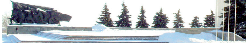
В Ульяновской области активно идет подготовка к празднованию 9 Мая.