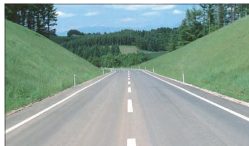
Дороги в муниципалитете станут лучше.

автодорог в муниципалитете, на ремонт автомобильных дорог местного значения планируется направить средства из регионального дорожного фонда в сумме более 7 млн. рублей, в том числе по поселениям: «Анненковское сельское поселение», «Выровское сельское поселение», «Гимовское сельское поселение», «Игнатовское городское поселение», «Майнское городское поселение», «Старомаклаушинское сельское поселение», «Тагайское сельское поселение».