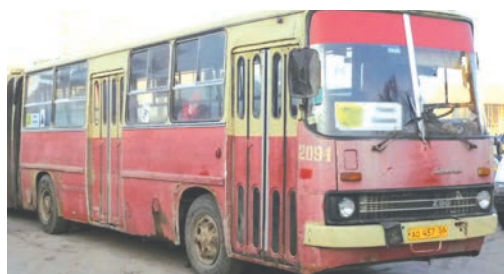
Перевозчик «выбросил» Шуватово из графика.