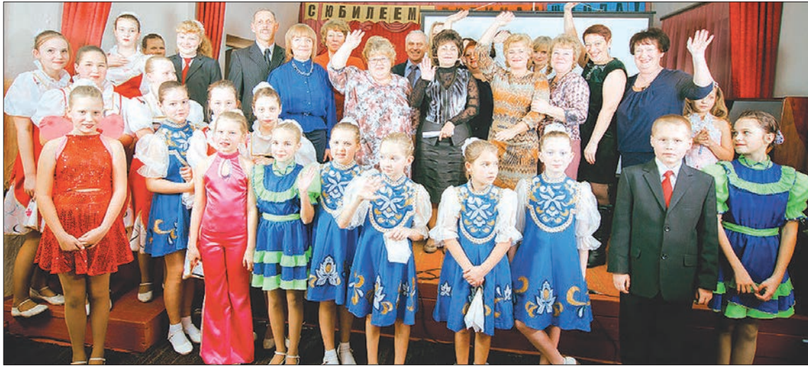
Для ребят каждое выступление – праздник.