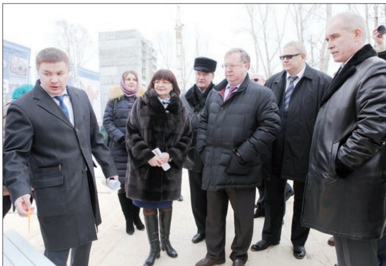
Сергея Степашина интересовал буквально каждый нюанс.

шим технологиям, позволяющим экономить на отоплении до 30 процентов энергии! Тут же сходу, впечатлившись увиденным, Константин Цицин предложил на крыше одного из новых домов установить солнечные батареи, что еще больше позволит сократить коммунальные платежи жителей. Представитель застройщиков обещал опробовать данный вариант.