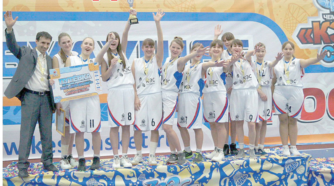
Лучшие спортсменки – из Новоспасского района.

ред, второй промах – и вот уже ульяновская команда лидирует. Вот уже игрок 35-й школы на линии штрафного броска. До конца игры остается всего 7 секунд. Первый бросок точен, второй – промах. Подбор за садовцами.