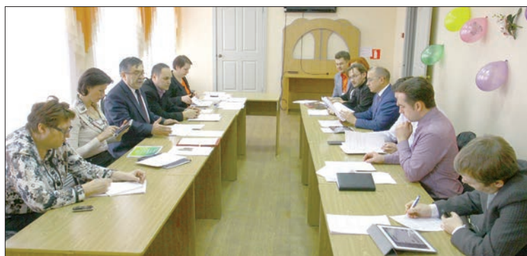
Решать проблемы вместе.

Вот уже несколько лет областной совет со всеми своими структурными подразделениями решает целый пласт задач, направленных на оздоровление института семьи. Это и демографические аспекты — сокращение разводов, аборт, увеличение рождаемости. Короткая аббревиатура ЗОЖ — здоровый образ жизни, а как много за ней стоит. Это и отказ от курения, от употребления спиртного, и активное занятие спортом, и соблюдение духовно-нравственных принципов.