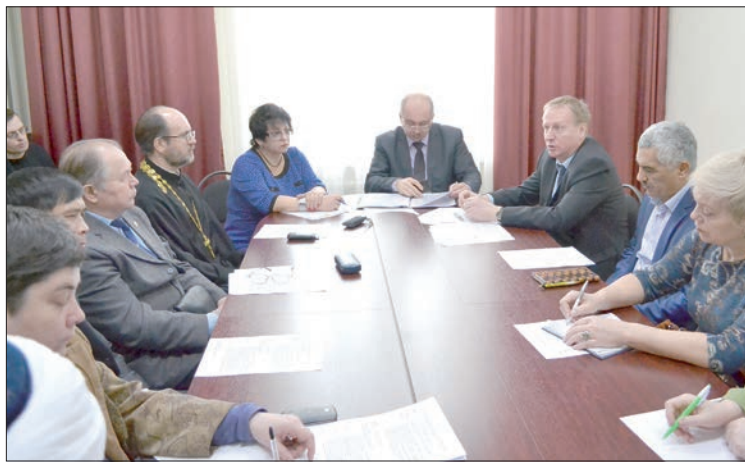
На круглом столе обсудили актуальные проблемы.

Согласно Концепции государственной миграционной политики РФ на период до 2025 года, важными элементами миграционной политики являются создание условий для адаптации и