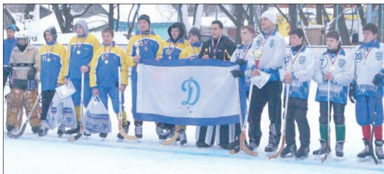
Турнир «Динамо» собрал юных спортсменов-детдомовцев.

VI Областной турнир по хоккею с мячом на кубок Ульяновского регионального отделения общества «Динамо» и призы детского фонда «Динамо» среди воспитанников областных государственных учреждений для детей-сирот и детей, оставшихся без попечения родителей, прошел в р.п. Майна.