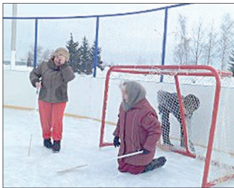
Пенсионеры и молодым фору дадут!

И эти состязания оставили такой глубокий след, что каждый участник и все болельщики в один голос сказали: «Почему же раньше не проводили такие праздники? И дальше нужно будет продолжить эту традицию».