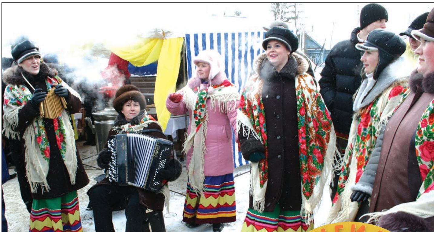
Масленичные гулянья в Сенгилее проходят с размахом!