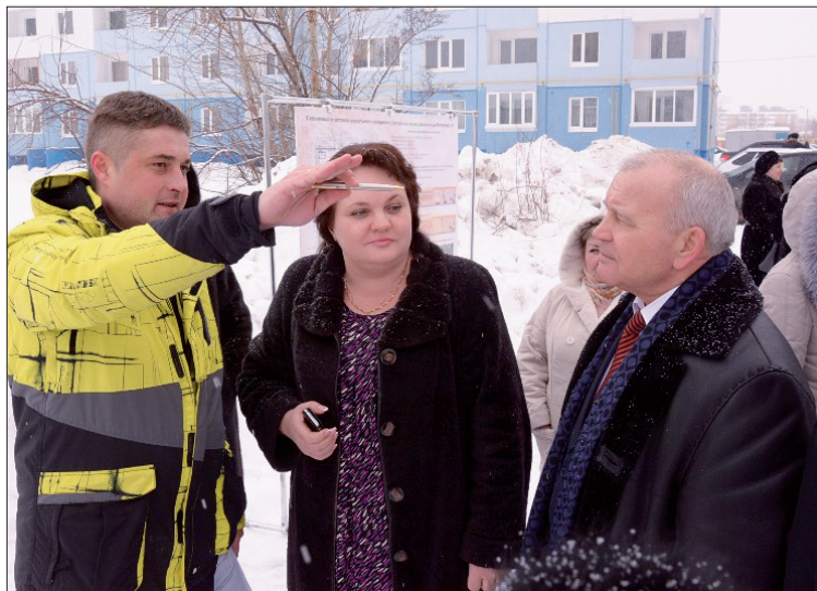
В центральной части города построят новый детский сад.