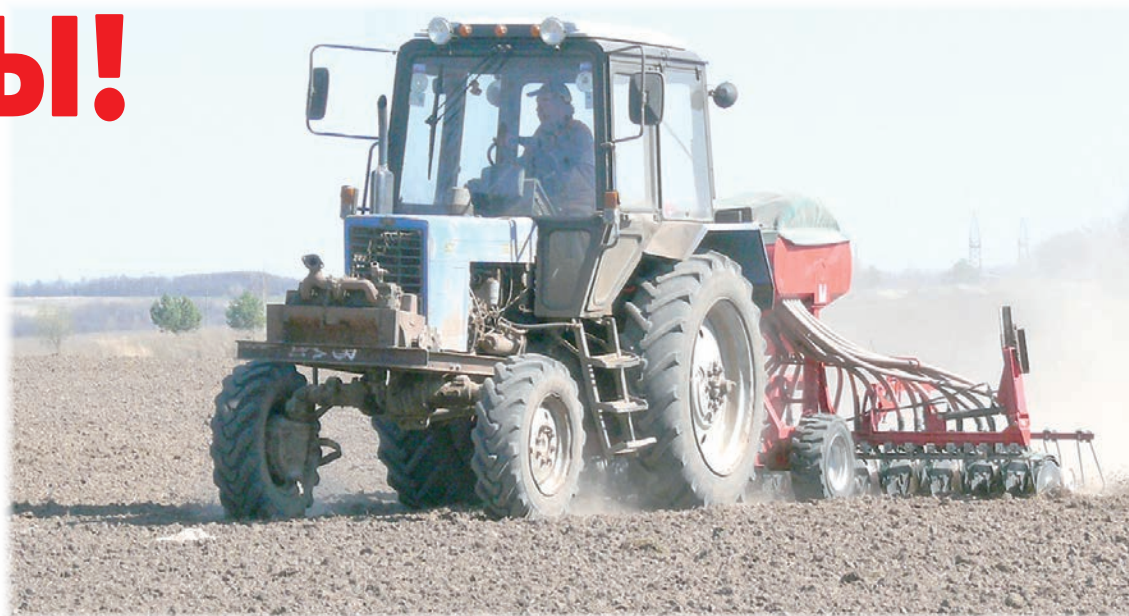
На урожаях озимых засуха скажется не катастрофически.

В полной потребности и хорошего качества засыпаны семена яровых культур в объеме 1 760 тонн, в том числе кондиционных – 100%. В минувшем году