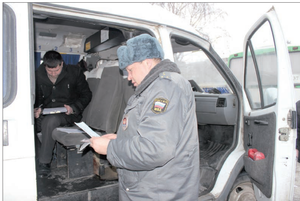
В «Газели» установлены ремни безопасности без документов.

Подобные контрольно-профилактические мероприятия в отношении перевозчиков департамент транспорта министерства строительства, ЖКК и транспорта совместно с УГИБДД УМВД России, УГАДН и управлением экономической безопасности и противодействия коррупции УМВД России по Ульяновской области проходят регулярно. Во время проверок выявляют соответствие пассажирского транспорта установленным стандартам. Контролируют оснащение автобусов ремнями безопасности, тахографами, информационными щитами, средствами ГЛОНАСС. Самые частые нарушения – отсутствие информации в салоне о расписании, схеме маршрута, перевозчике и о том, в какой компании застраховано транспортное средство. Нерадивых приходится штрафовать, водителей могут наказать до 3 – 5 тысяч рублей, юрлиц за повторное нарушение до 15 – 30 тысяч рублей.