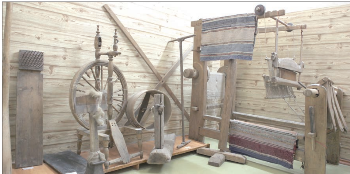
Полный цикл изготовления ткани можно увидеть в школьном музее.

было также связано дорожной темой: изготовление колес, ободьев, ремонт всего этого добра.