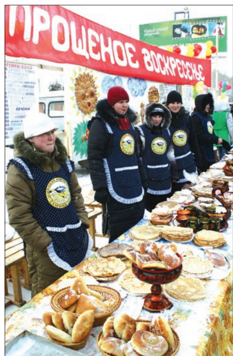
Угощение на любой вкус.