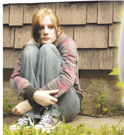
Ребят учили быть смелыми и незакомплексованными.

Задачи прошедшего тренинга: сплотить детей; создать атмосферу группового доверия и принятия; научить детей контролировать свои действия; научить в приемлемой форме выплескивать накопившийся гнев; развивать эмоциональную сферу ребенка; снять эмоциональные и мышечные зажимы; снять эмоциональное напряжение, агрессию.