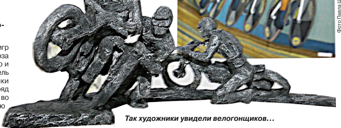
Так художники увидели велогонщиков...

дентов творческих вузов, учащихся детских школ искусств. Да простят меня маститые авторы, но именно благодаря скульптурным и живописным работам начинающих художников экспозиция получилась яркой и разнообразной.