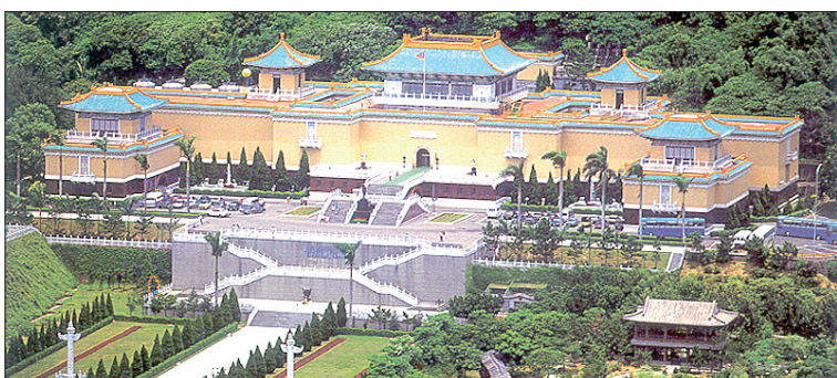
Национальный дворец-музей на Тайване.

музей Ленина в Ульяновске посетили 1,2 миллиона человек в год)», – пишет газета The Art Newspaper Russia. Для того чтобы реализовать проект, по мнению экспертов издания, потребуется не менее 1 миллиарда 15 миллионов долларов!