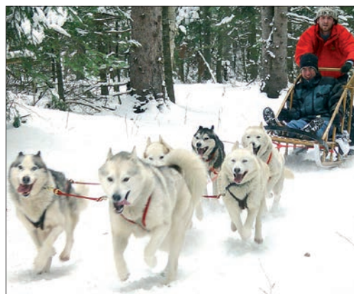
По Волге с ветерком.

В скорости и мастерстве в управлении таким необычным по нынешним временам транспортом будет участвовать 20 каюров (погонщиков собак). В каждой упряжке 8 – 12