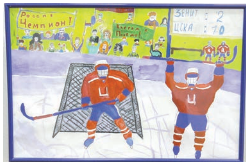
... и хоккеистов.

Тем не менее Ульяновское отделение Союза художников России организовало выставку «Искусство и спорт» по собственной инициативе. Да еще и привлекло большое количество юных и молодых талантов – студ-