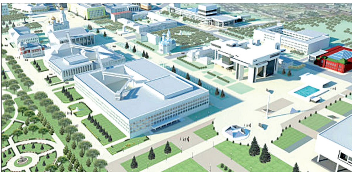
Музей СССР в Ульяновске.

Когда ты холостяк – все валяется по своим местам. Женился – и все аккуратно сложено черт знает где!