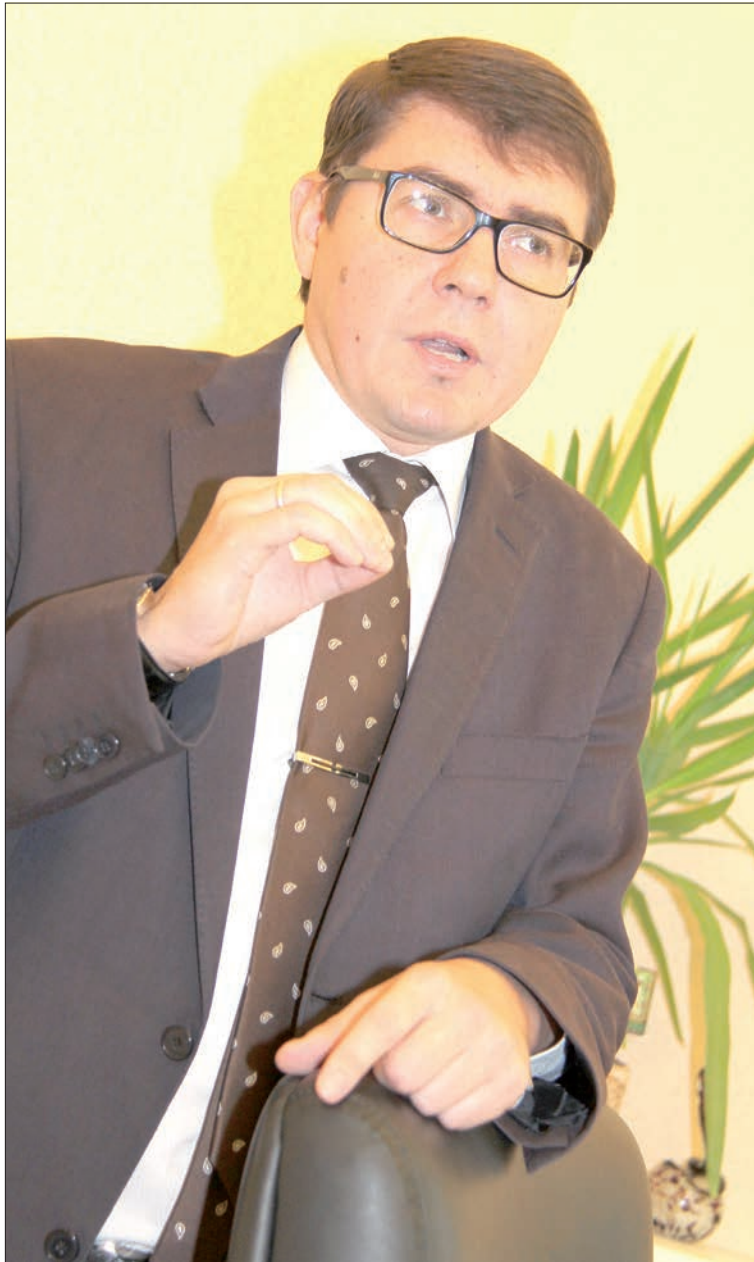
Люблю историю, биологию и ...бизнес!

– Основной мой спорт – это работа. Она позволяет мне себя держать в тонусе. В спортивный зал не хожу, потому как не могу найти для этого времени. С белой завистью отношусь к тем людям, которые могут грамотно распределить свое время, чтобы