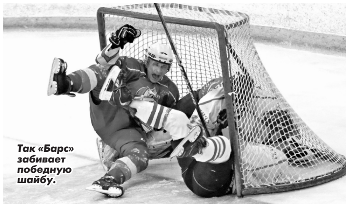
Так «Барс» забивает победную шайбу.