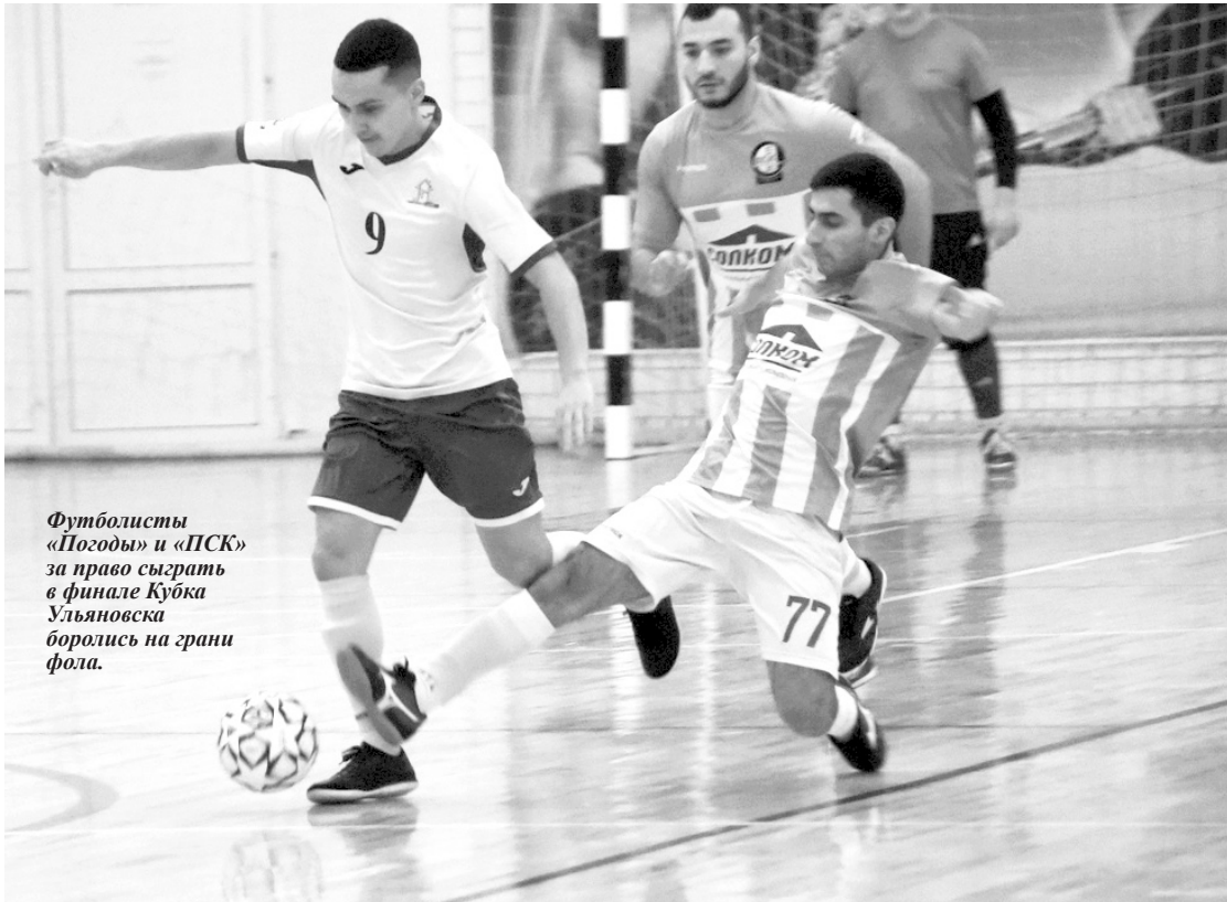
Футболисты «Погоды» и «ПСК» за право сыграть в финале Кубка Ульяновска боролись на грани фола.