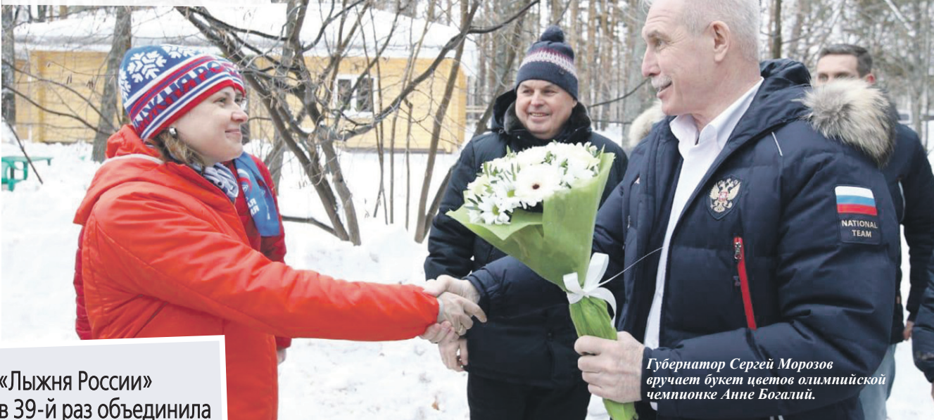
Губернатор Сергей Морозов вручает букет цветов олимпийской чемпионке Анне Богалий.