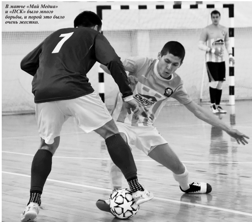
В матче «Май Медиа» и «ПСК» было много борьбы, и порой это было очень жестко.