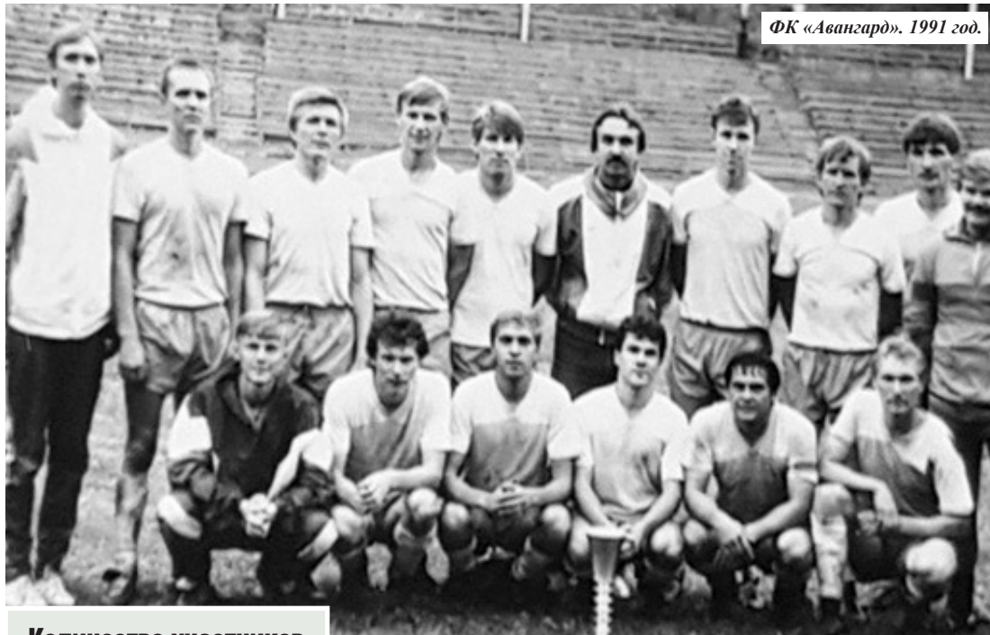
ФК «Авангард». 1991 год.