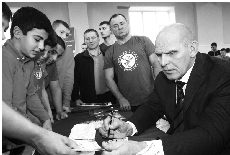
На автографы ушла целая сотня открыток с изображением Александра Карелина. Но и этого оказалось мало!

Главных три жизненных правила, которым нужно придерживаться вам, юные спортсмены, - обратился прославленный борец к юным воспитанникам ульяновской школы борьбы. - Первое: не обманывать родителей. Второе: слушаться и уважать тренера. И наконец, стричь ногти, чтобы во время тренировок и соревнований не нанести травму своему партнеру или сопернику.