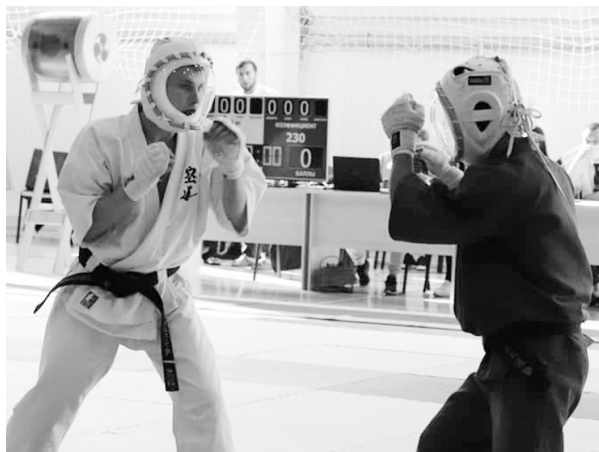
Ульяновский ФОК «Орион» увидел бои сильнейших кудоистов России.

Первые за время пандемии всероссийские состязания по кудо состоялись на базе ФОКа «Орион», собрав около