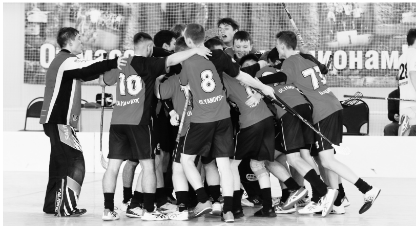
Дебютный сезон среди команд Высшей лиги «Солнечные Орлы» завершился красивой победой.

Результаты этих матчей уже не могли глобально повлиять на турнирное положение «Орлов». Тягаться с топами отечественного флорбола они пока объективно не готовы, но при этом место в Высшей лиге на будущий сезон гарантировали себе досрочно. Все из-за отказа приехать в Нижний команды «Арена-Ураган», которая теоретически могла бы обой-