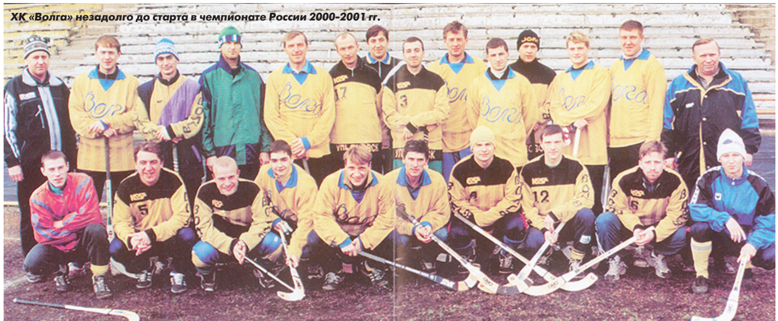
ХК «Волга» незадолго до старта в чемпионате России 2000-2001 гг.