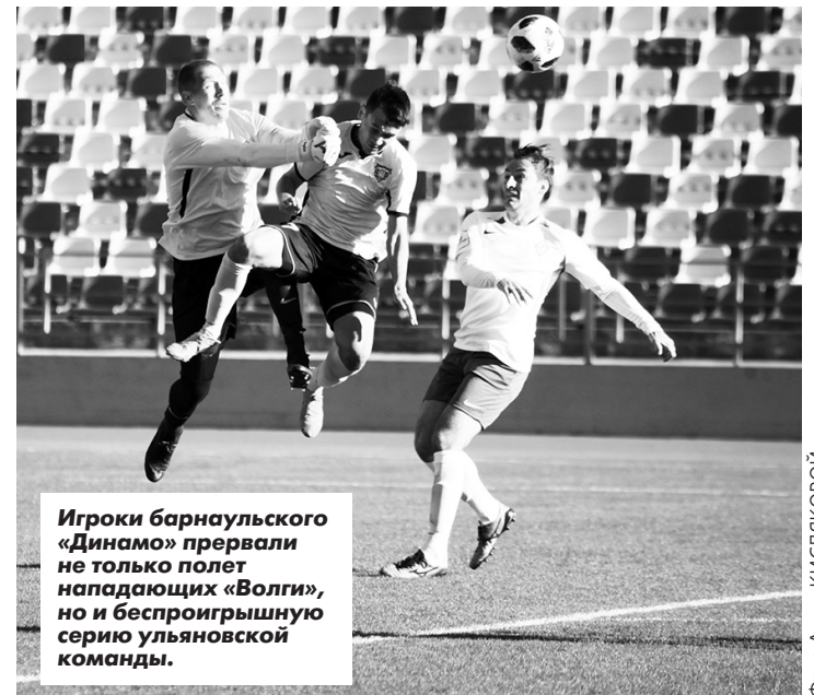
Игроки барнаульского «Динамо» прервали не только полет нападающих «Волги», но и беспроигрышную серию ульяновской команды.