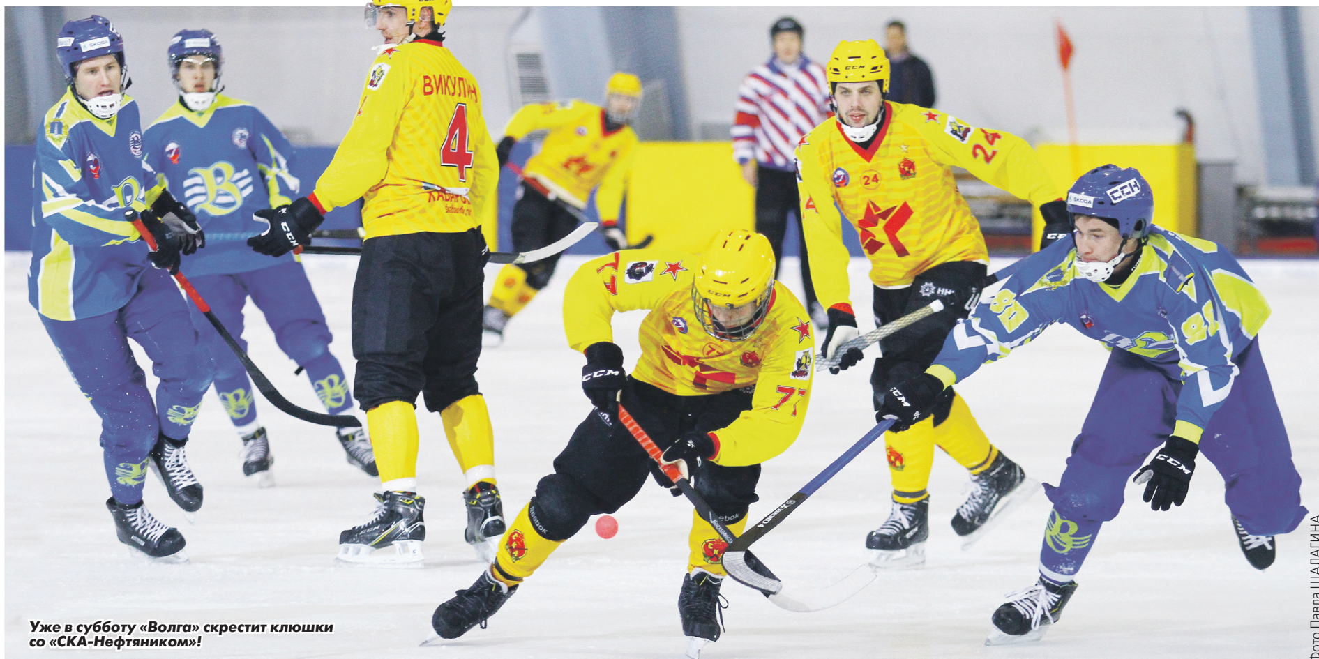
Уже в субботу «Волга» скрестит клюшки со «СКА-Нефтяником»!

С 9 по 18 октября в Ульяновске пройдут «Финал четырех» Кубка России и V традиционный турнир Кубок «Волга-Спорт-Арены». За десять дней болельщики смогут увидеть сразу 19 матчей.