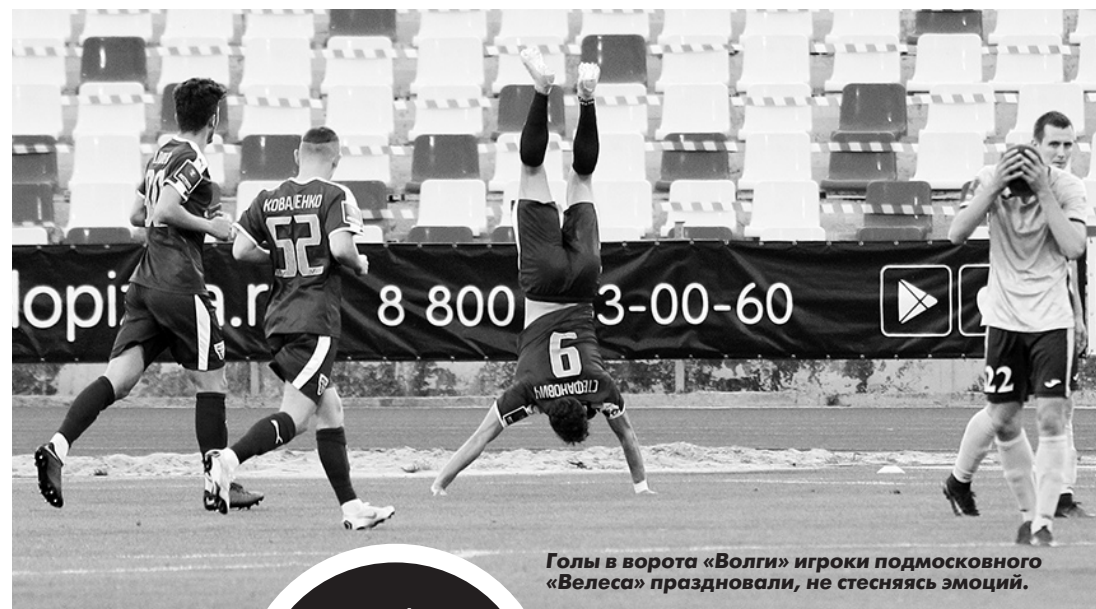
Голы в ворота «Волги» игроки подмосковного «Велеса» праздновали, не стесняясь эмоций.

- Было несколько предложений, но ни одно не срослось, - говорит КУЗНЕЦОВ. - Не исключено, что завершу карьеру, хотя мог бы поиграть еще несколько лет - силы есть. Правда, задумываюсь и о тренерской стезе. Не исключаю, что в ближайшее время начну учиться на категорию С. И все же надеюсь, что