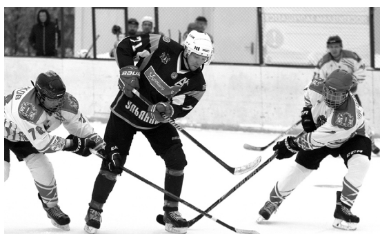
Хоккеисты «Гулливвера» и «Симбирских Львов» разыгрывают первую в сезоне зимнюю классику.