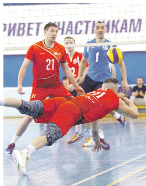
Игроки казанской команды «Фикс» в матче с ульяновским «Динамо» летали за каждым мячом, но от поражения их это не спасло.

Следующий тур чемпионата страны среди мужских команд первой лиги пройдет в конце февраля в Альметьевске.