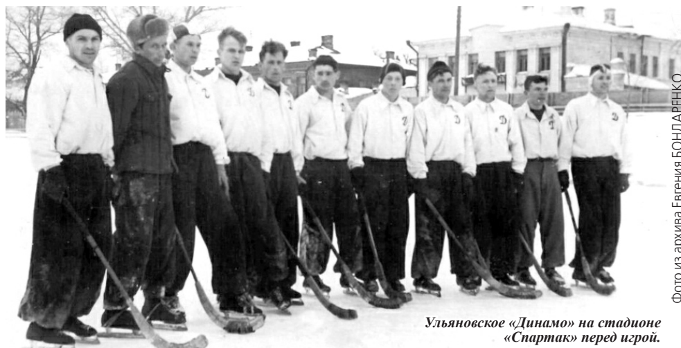
Ульяновское «Динамо» на стадионе «Спартак» перед игрой.

Наверняка на матче ульяновского «Динамо» и свердловского ОДО присутствовал легенда русского хоккея, семикратный чемпион мира, воспитанник уральского хоккея Николай Дураков. Однако чуть больше года назад 86-летний ветеран перенес инсульт. Прогнозы врачей были не самыми оптимистичными, но вопреки всему Николай Александрович живет, правда, общается он с трудом и только со своей семьей.