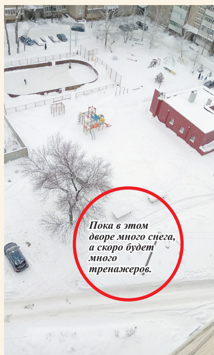
Пока в этом дворе много снега, а скоро будет много тренажеров.

К Первомайским праздникам жители многоквартирных домов в Засвияжском районе Ульяновска получат в свое распоряжение более десяти новых антивандалных тренажеров. Их установят в рамках реализации проекта, который победил в конкурсе президентских грантов.