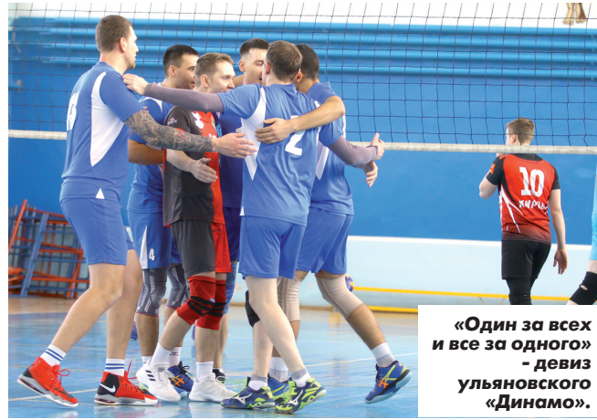
«Один за всех и все за одного» - девиз ульяновского «Динамо».

Несмотря на победу над кировским «Динамо», ульяновцы заняли четвертое место в своей подгруппе и теперь сыграют в турнире за 5-8-е места в первой лиге. Матчи пройдут в феврале и марте. Место их проведения станет известно позже.