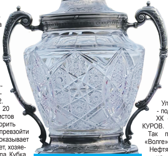
Судьба почетного трофея решится на глазах ульяновских болельщиков.

Впрочем, один спор у хабаровца Ульяновск уже выиграл - завоевал право провести у