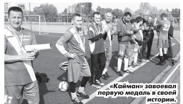
«Кайман» завоевал первую медаль в своей истории.

Примечание: команда «Бриг» занимает место выше «Университета» по результату личной встречи - 3:1.