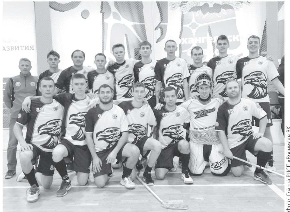
«Солнечные Орлы» на туре в Архангельске.

Впрочем, нижегородцы не собирались выбрасывать белый флаг и сократили отставание до минимума. В заключительные восемь минут обороны ульяновцев пришлось выдерживать серьезное давление. При этом наши парни старались защищаться через контроль мяча и проводить регулярные контратаки, не позволяя «Мининскому Университету» снять вратаря. Лишь за 22 секунды до конца соперник сумел создать искусственное большинство, но и это ему не помогло. «Орлы» выстояли и оформили победу - 4:3.