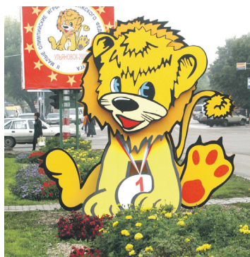
Львенок - талисман II Малых Олимпийских игр.

В Ульяновске и Димитровграде состоялись II Малые Олимпийские игры Приволжского федерального округа.