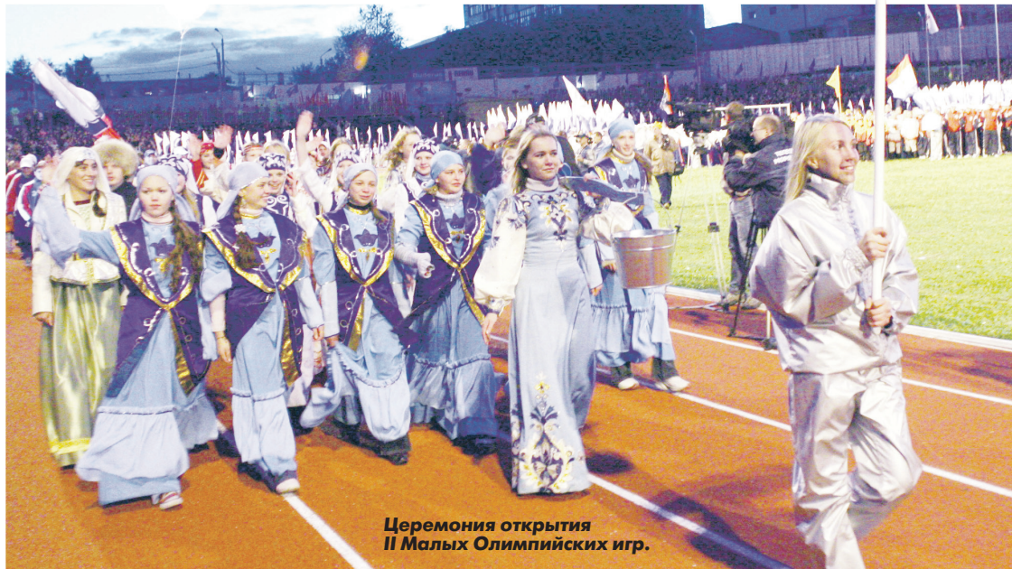
Церемония открытия II Малых Олимпийских игр.