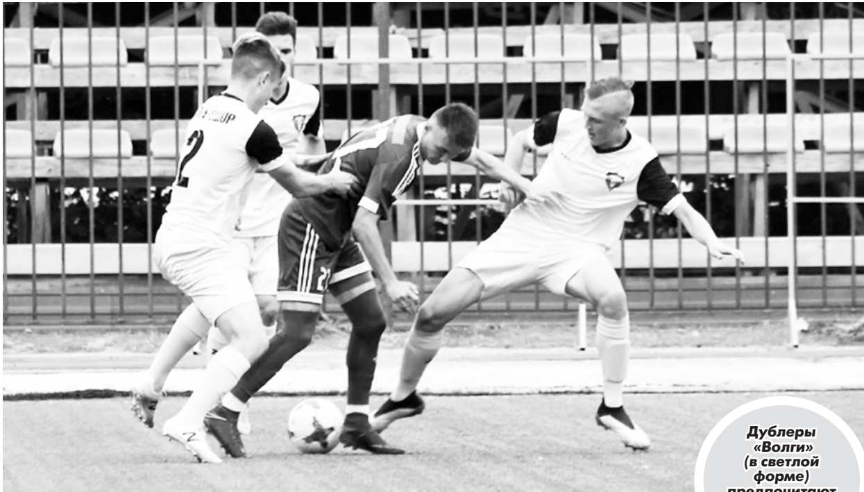
Дублеры «Волги» (в светлой форме) предпочитают коллективный отбор мяча.

Дублеры «Волги» роскошно начали вторую половину сезона. В домашнем матче 18-го тура ульяновцы добились разгромной победы над соперниками из Ижевска, повторив успех главной команды.