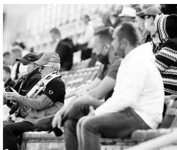
В Димитровград вернулся футбол, а зрители - на стадион.