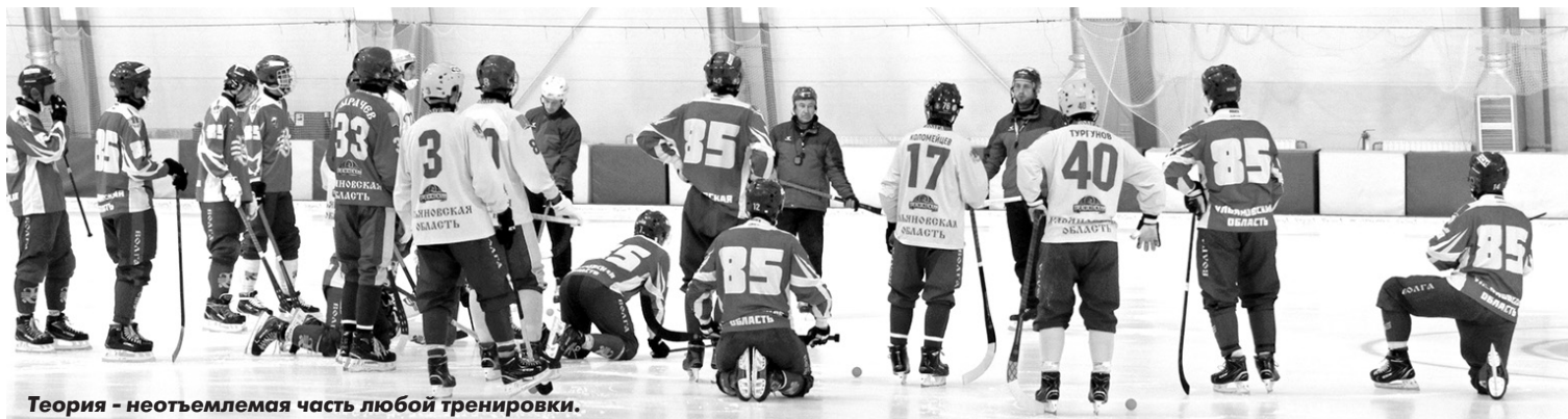
Теория - неотъемлемая часть любой тренировки.