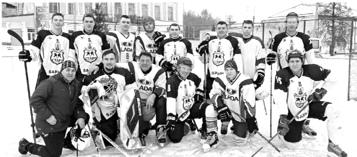
Барышский «Старт» - традиционный участник чемпионата области.

«Запад»: Сура - Старт - 2:5, Шторм - Витязь - 8:6, Витязь - Сура - 5:4, Старт - Шторм - 3:4(Б). «Восток»: Заря-Колос - Барс - 3:0, Цементник - Нефтяник - 3:4 (ОТ), Цементник - Барс - 5:4, Нефтяник - Заря-Колос - 11:2.