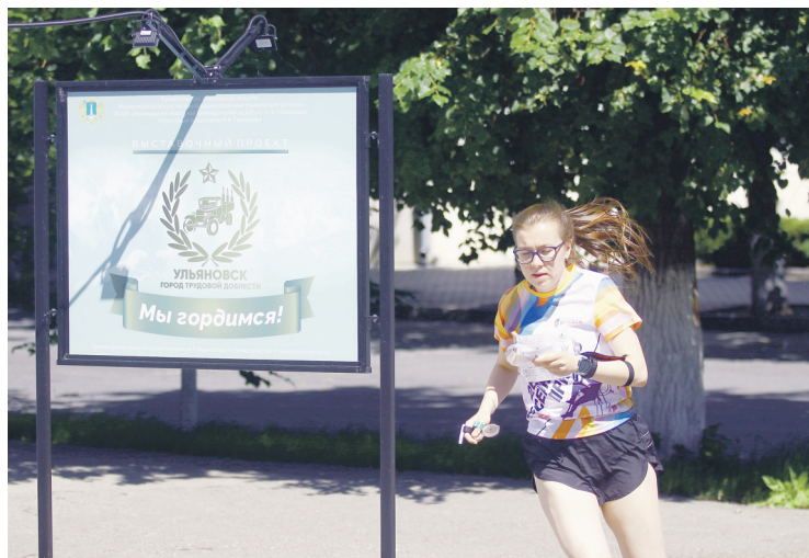
На протяжении трех дней Ульяновск был столицей студенческого ориентирования России.