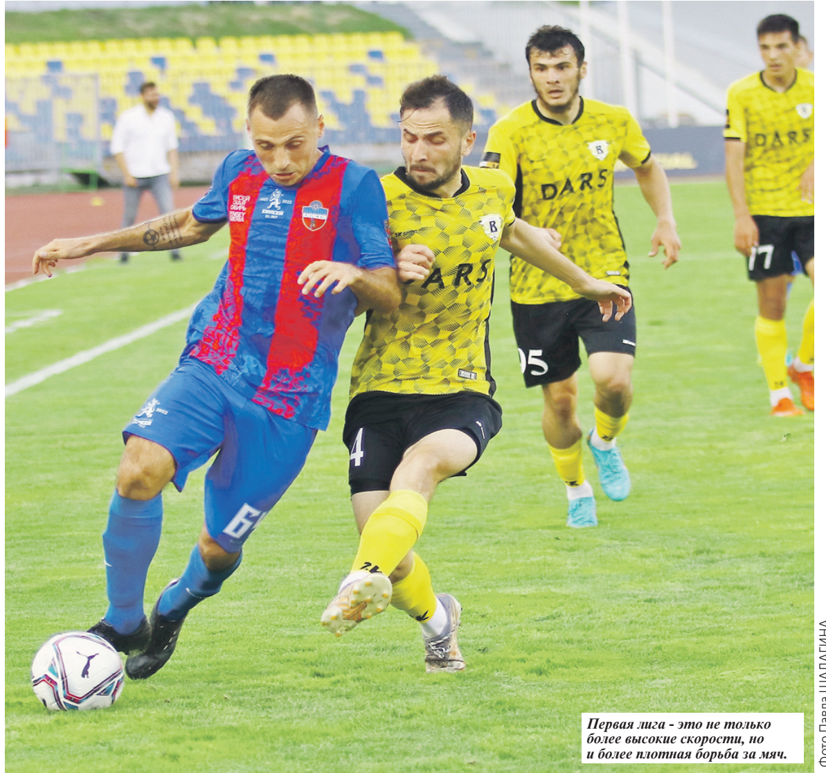
Первая лига - это не только более высокие скорости, но и более плотная борьба за мяч.