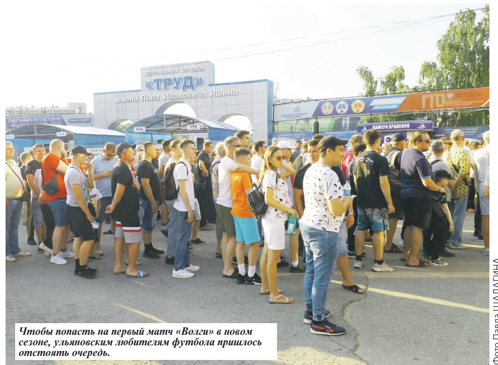
Чтобы попасть на первый матч «Волги» в новом сезоне, ульяновским любителям футбола пришлось отстоять очередь.