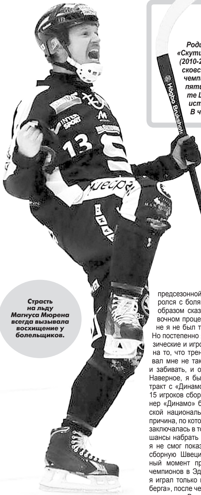
Страсть на льду Магнуса Мюрена всегда вызвала восхищение у болельщиков.

Родился 4 ноября 1974 года в Скутшере. Выступал за шведские клубы: «Скутшер» (1992-1993), «Сандвикен» (1993-2005, 2007-2010, 2013-2014), ГАИС (2010-2013), «Вилла» (2016), российские клубы: «Зоркий» (2005-2006), московское «Динамо» (2006-2007), «Ракету» (2007). Четырехкратный чемпион мира (1997, 2003, 2005, 2009), обладатель Кубка мира (2002), пятикратный чемпион Швеции (1997, 2000, 2002, 2003, 2014). В чемпионате Швеции забил 733 мяча, что является вторым результатом за всю историю. Больше забитых мячей только у Йонаса Клаессона (771). В чемпионатах России провел 39 матчей, забил 37 мячей.