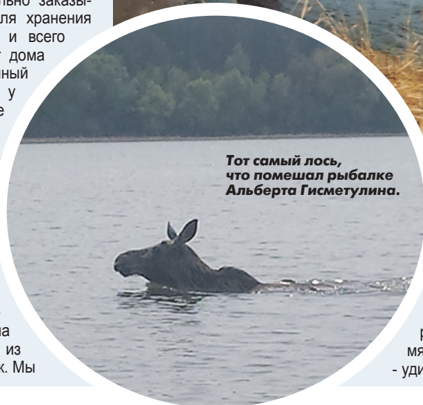
Тот самый лось, что помешал рыбалке Альберта Гисметулина.

поселились в частном доме, на месте которого сейчас раскинулся микрорайон Свяеге. До реки от нас было около 400 метров. Вот с самого детства с соседскими мальчишками мы и бегали на Свяегу рыбу удить. Долгое время это было просто хобби - удил простыми удочками, на