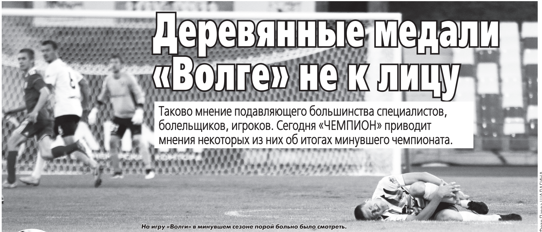
На игру «Волги» в минувшем сезоне порой больно было смотреть.

Таково мнение подавляющего большинства специалистов, болельщиков, игроков. Сегодня «ЧЕМПИОН» приводит мнения некоторых из них об итогах минувшего чемпионата.