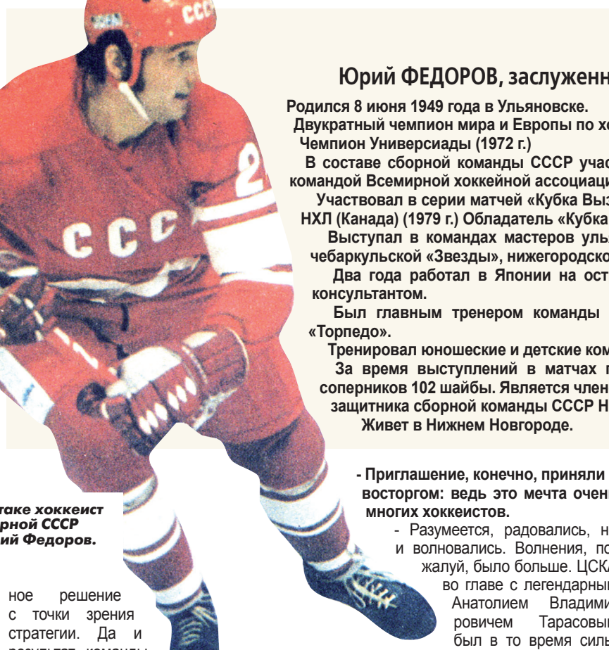
В атаке хоккеист сборной СССР Юрий Федоров.

В автозаводской команде намечались серьезные перемены. Старший тренер Мордухович взял курс на омоложение состава. На мой взгляд, это было правиль-