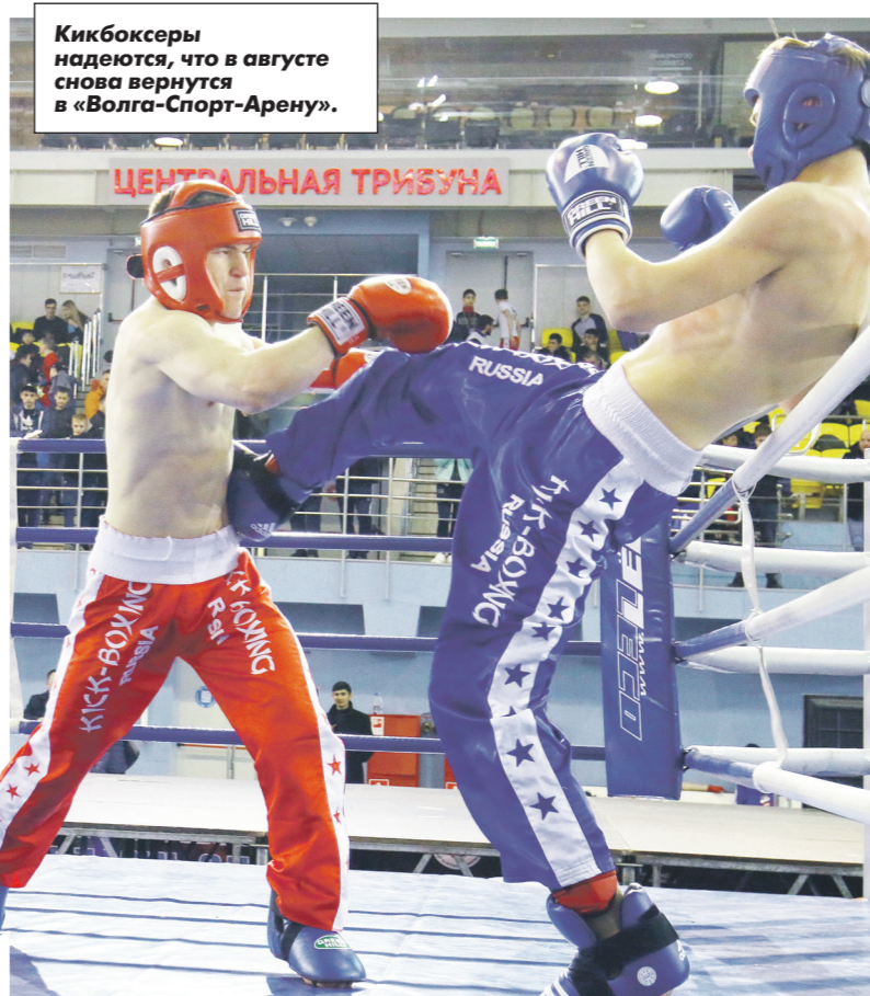
Кикбоксеры надеются, что в августе снова вернутся в «Волга-Спорт-Арену».

Ульяновские болельщики с нетерпением ждали рестарта турнира в ПФЛ. Ведь зимой в их любимой «Волге» произошли кардинальные изменения - поменялась администрация клуба, сменился тренерский штаб, который пригласил десятых новичков, попутно расставившись с несколькими игроками прежнего состава. Обновленный коллектив провел достаточно плодотворный подготовительный сбор на Черноморском побережье России. В контрольных играх команда показывала весьма симпатичный футбол. Под первый домашний матч, который должен был состояться 7 апреля, специально готовили поле стадиона «Труд»