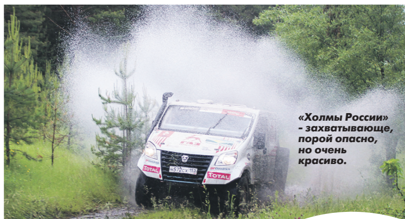
«Холмы России» - захватывающе, порой опасно, но очень красиво.