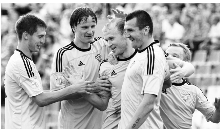
Поздравления от товарищей по команде принимает Марат Сафин (в центре).