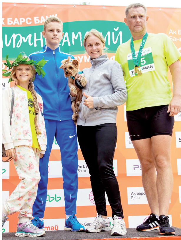
Верхнюю ступень пьедестала почта частенько можно переименовать в «егоровскую».