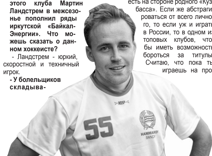
Итоговая таблица регулярного чемпионата Швеции

- Насколько я информирован, только один шведский клуб - «АИК» - дал твердое согласие играть на Кубке мира в России. Мое личное мнение - проведение Кубка мира в России станет большим шагом для развития нашего вида спорта. Не думаю, что траты шведских клубов сильно вырастут в случае проведения Кубка мира в России. Ведь когда тот же «Хаммарбю» едет на Кубок мира в Сандвикен, мы также