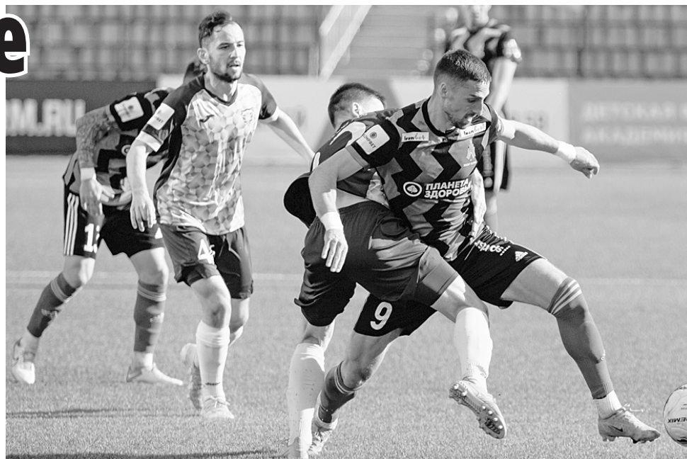
В матче «Амкара» и «Волги» плотная игра шла на протяжении всех 90 минут.

- На то, что мы в конце сезона оказались в такой ситуации, есть причины, - оправдывался на послематчевой пресс-конференции ХУЗИН. - В средней линии мы практически лишены ротации. У нас были планы взять троих сильных футболистов, но в последний момент сделать этого не удалось. Те ребята, что сейчас играют, очень стараются, выкладываются, но их усилий, увы, не хватает, чтобы бороться за самые высокие места.