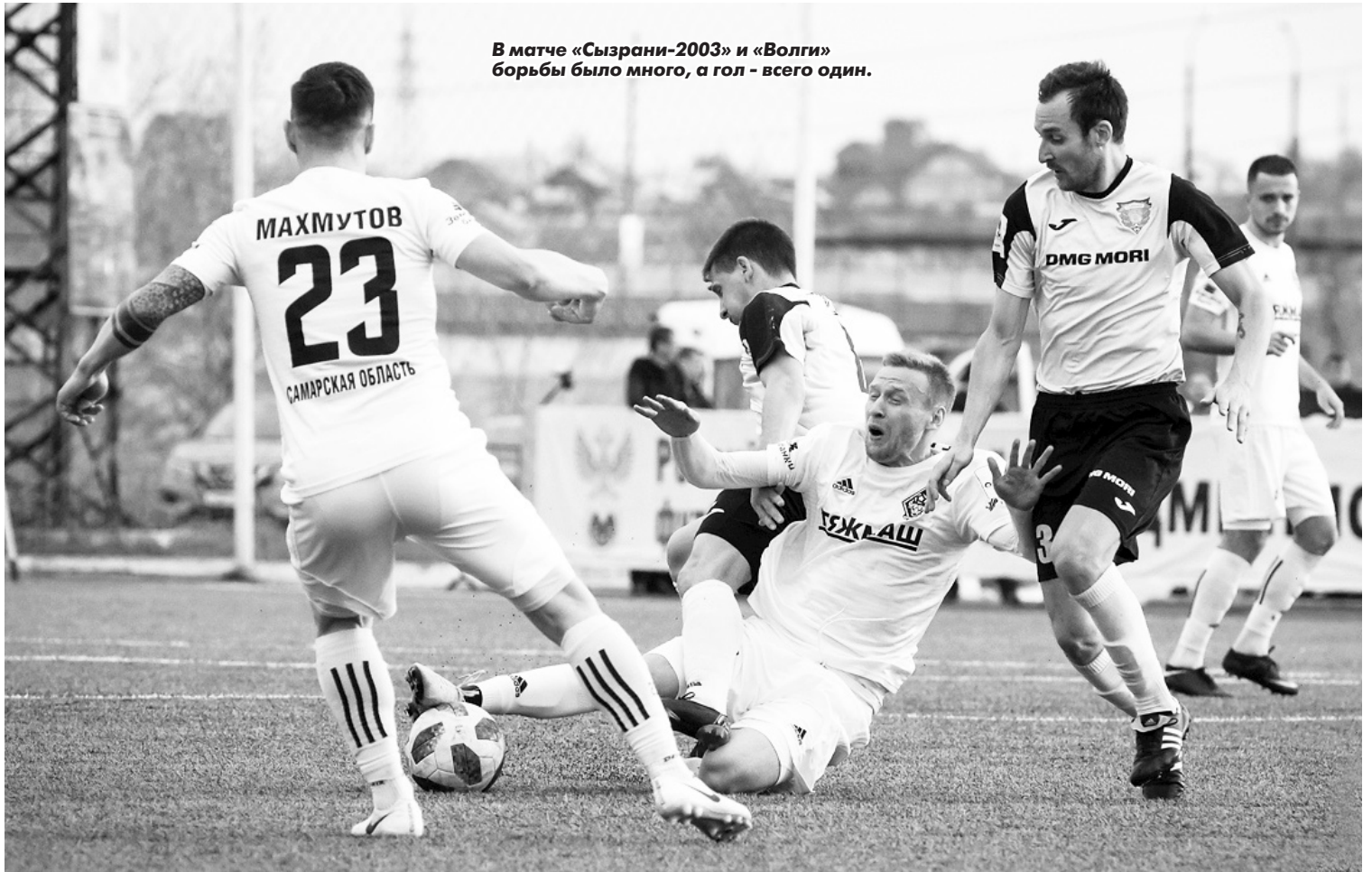
В матче «Сызрани-2003» и «Волги» борьбы было много, а гол - всего один.