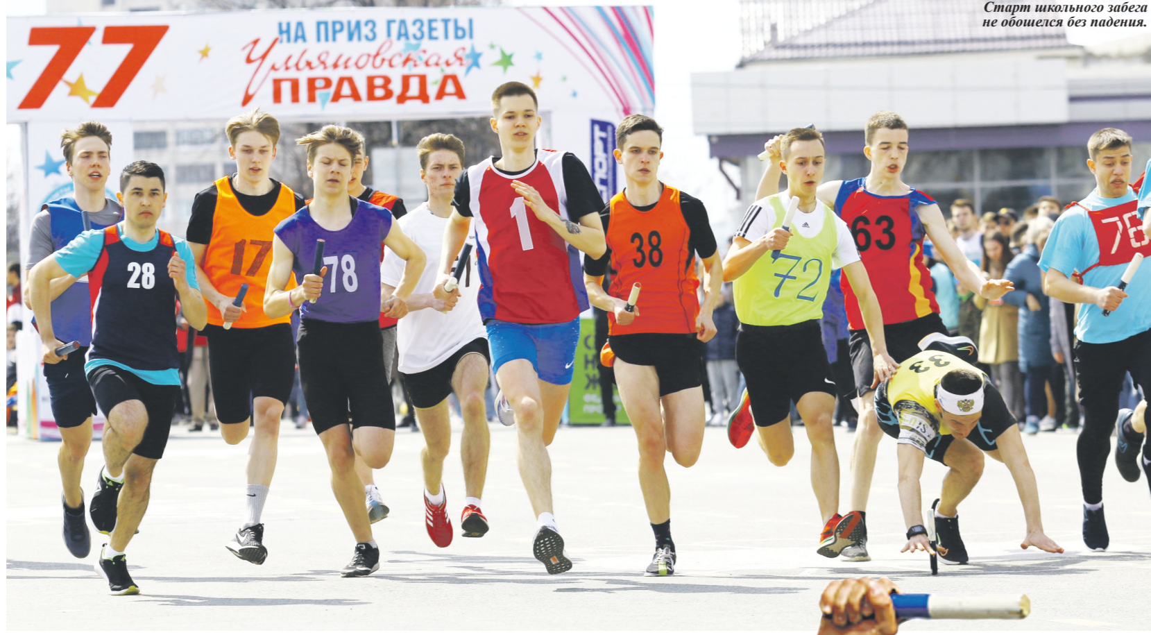
Старт школьного забега не обошелся без падения.