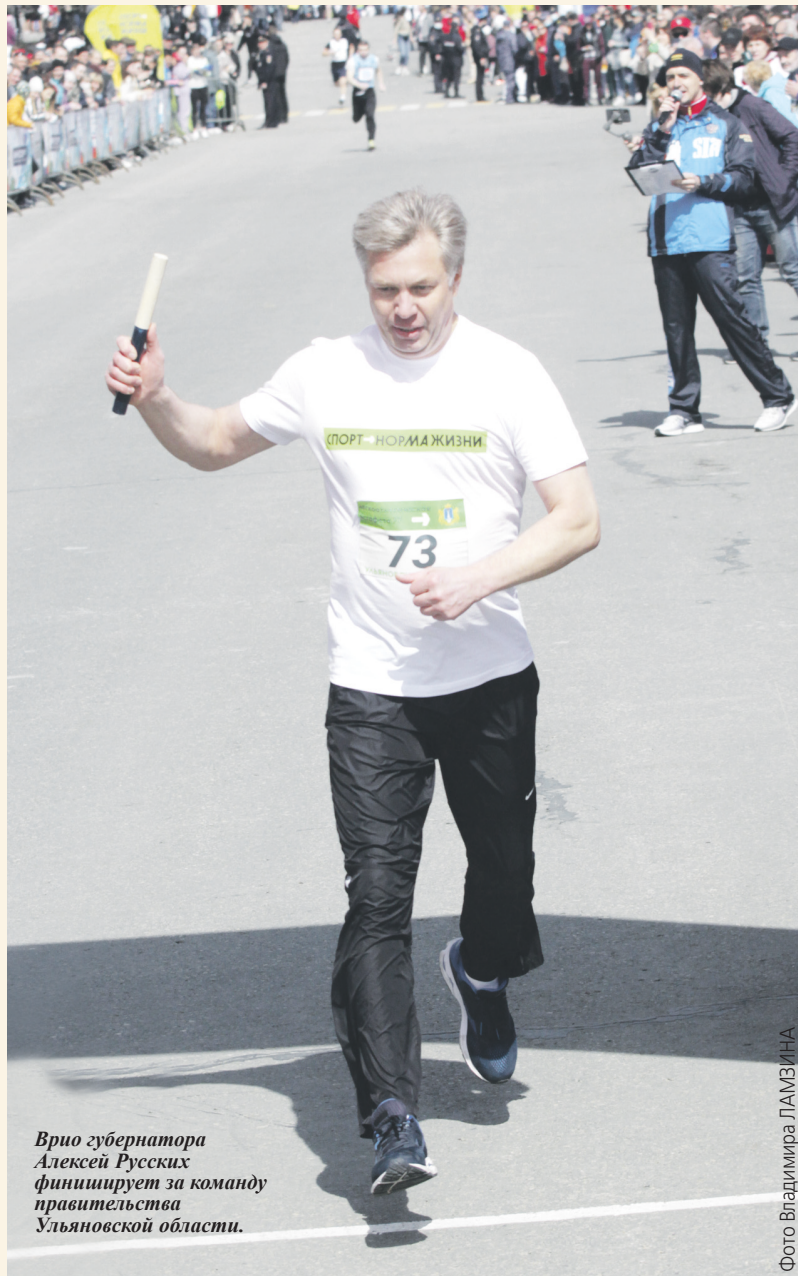
Врио губернатора Алексей Русских финиширует за команду правительства Ульяновской области.

- Эстафета - это всегда эмоции, дающие позитивный толчок для дальнейшего занятия спортом, - в свою