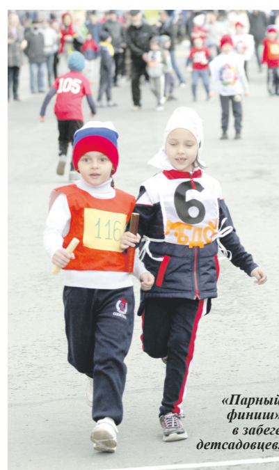
«Парный финиш» в забеге детсадовцев.

Свой многократный чемпион есть и в забеге слабовидящих спортсменов, где пальмой первенства безраздельно владеет первая команда воспитанников спортивно-адаптивной школы