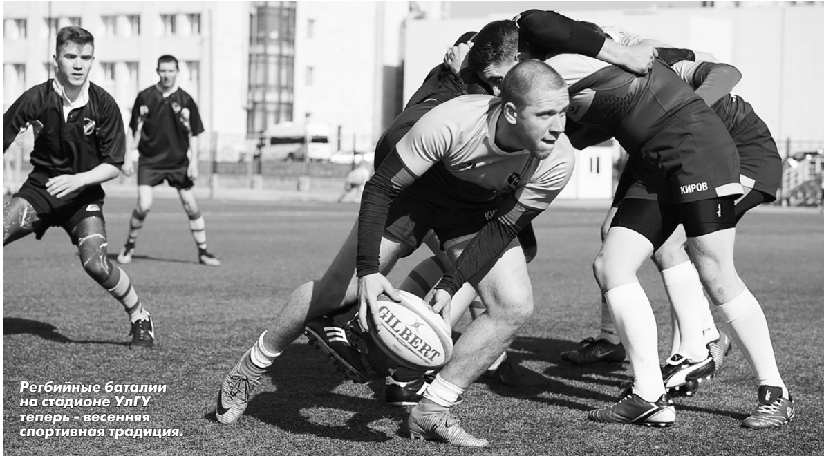
Регбийные баталии на стадионе УлГУ теперь - весенняя спортивная традиция.

Ульяновск во второй раз в своей истории принял Поволжский этап Всероссийской Универсиады. Честь региона защищали студенты и студентки Ульяновского педуниверситета.