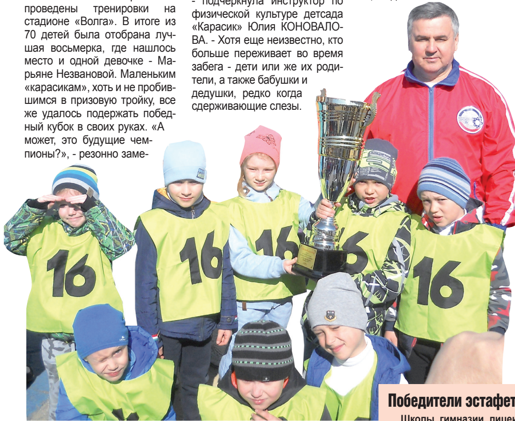
Победители эстафеты в Заволжском районе

Победителями в других зачетных группах стали команды детского сада № 226 «Капитошка» и Ульяновского механического завода.