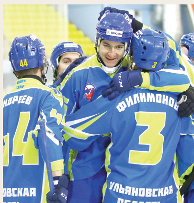
Хоккеисты «Волги» играют для болельщиков и поддерживают их в трудную минуту.