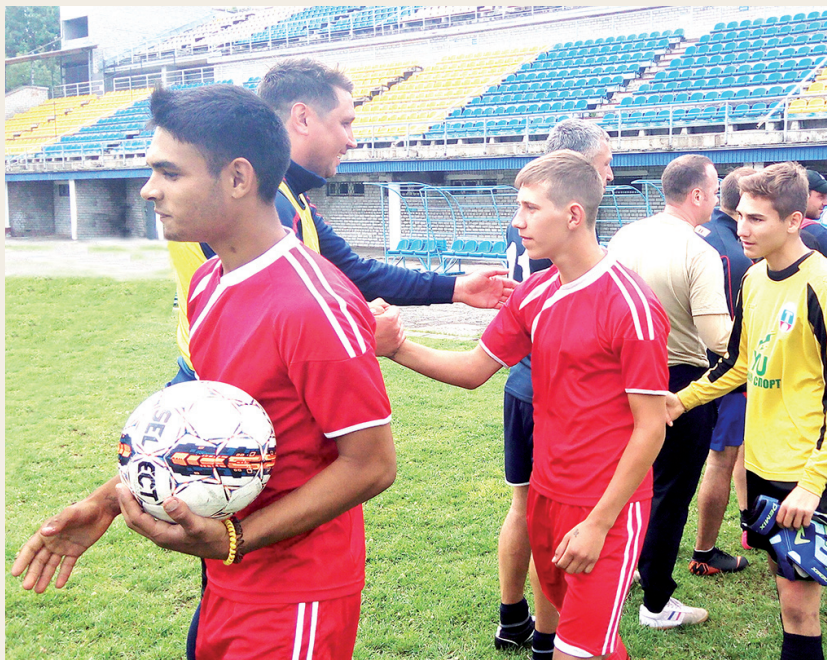
13 июля 2019 года. Воспитанники детского дома «Планета» в гостях у ФК «Лада» (Димитровград).