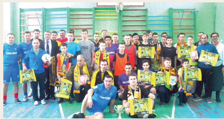
14 января 2020 года. Игроки и представители ФК «Волга» и ФК «Лада», а также ветераны ульяновского спорта побывали в Ивановском детском доме и провели мастер-класс, сыграв в турнире «Единство».