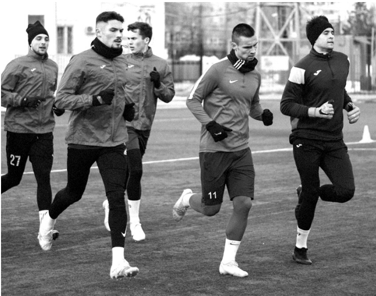
Новые футболисты «Лады» привыкают к газону стадиона «Старт», где им предстоит сыграть уже через неделю.

Дмитровградская «Лада» вернулась с южных сборов и начала финальный этап подготовки к ближайшим официальным матчам в рамках чемпионата ПФЛ.