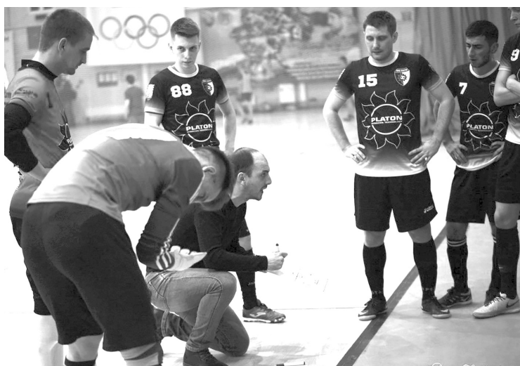
В тайм-аутах у «Платона» минимум эмоций, максимум конструктива.

- И это говорит игрок, который несколько раз в составе не-