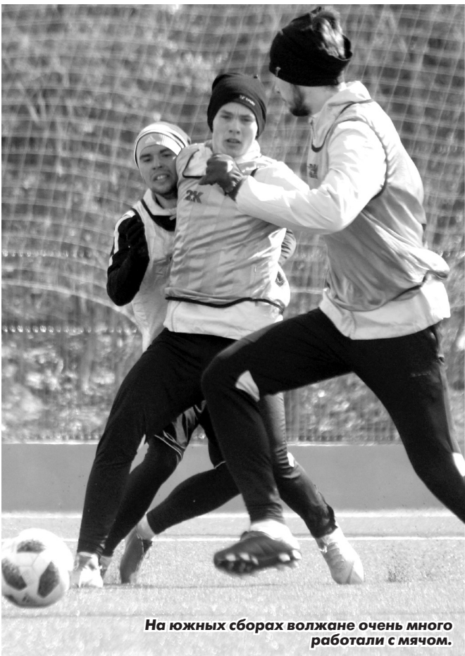
На южных сборах волжане очень много работали с мячом.