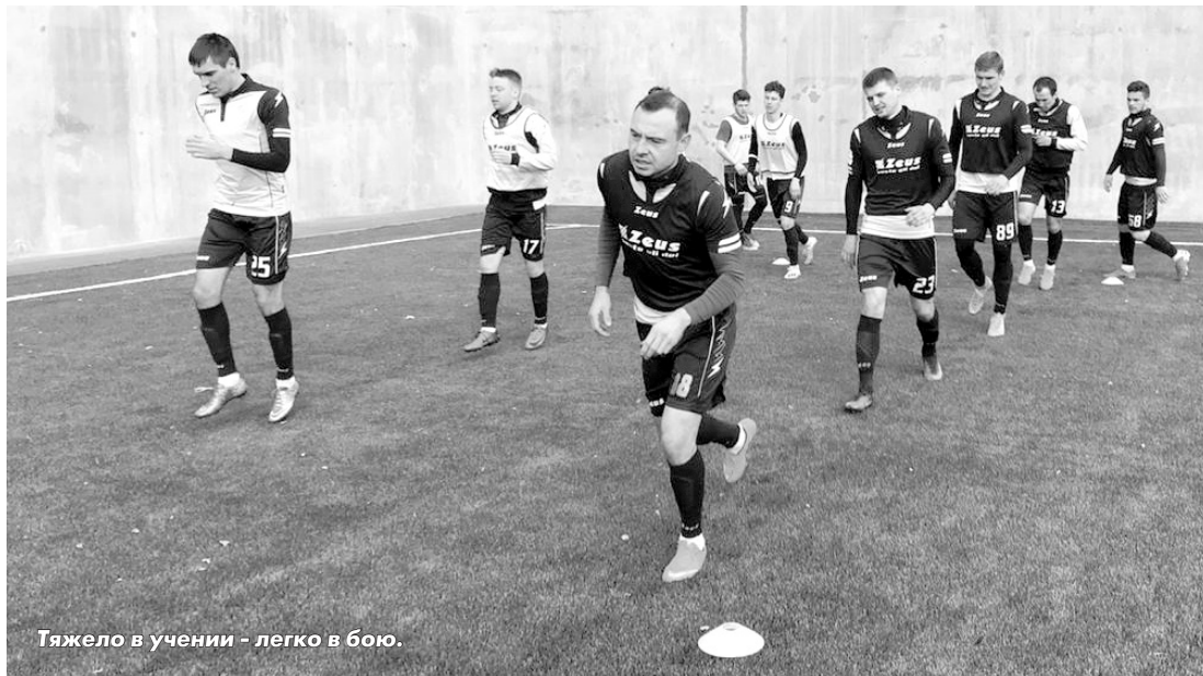
Тяжело в учении - легко в бою.

- Насколько молодежь вашей команды сумела заявить о себе на этом сборе?