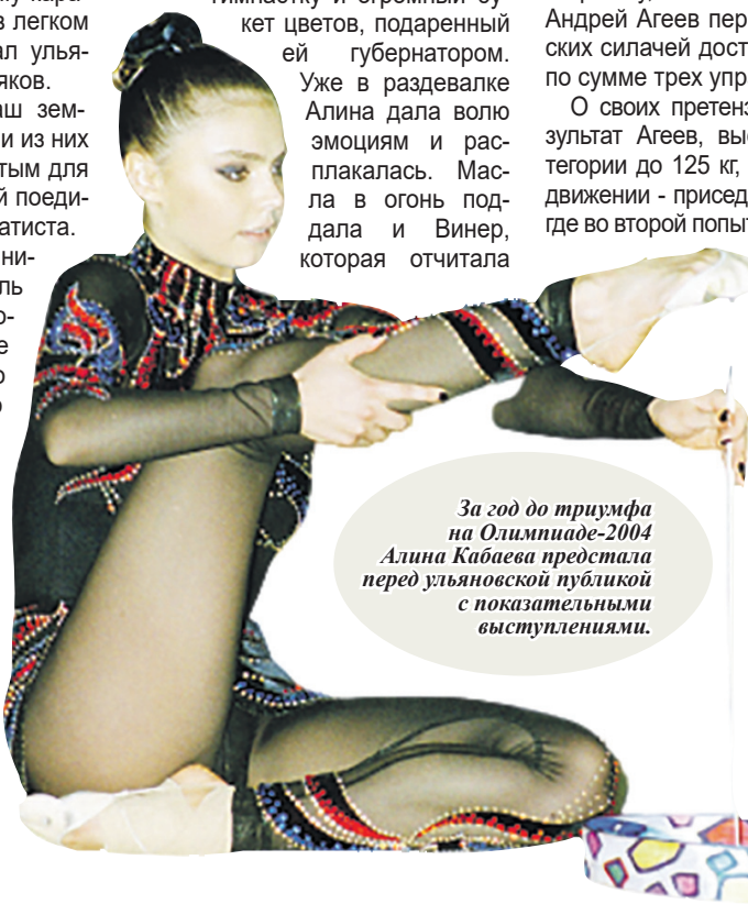
За год до триумфа на Олимпиаде-2004 Алина Кабаева предстала перед ульяновской публикой с показательными выступлениями.