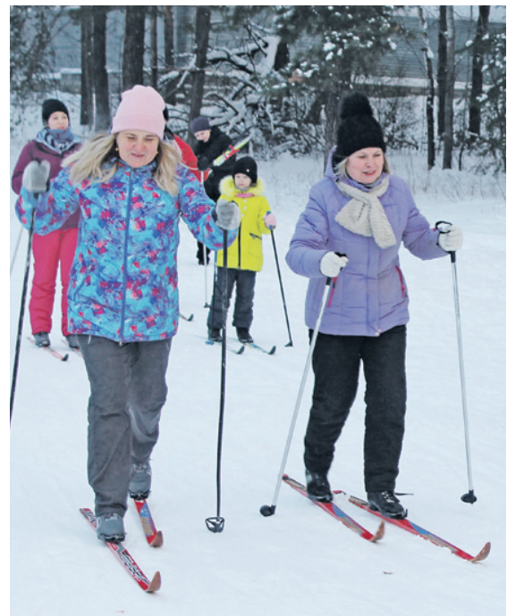
Лыжная база «Динамо» примет всех любителей физкультуры!