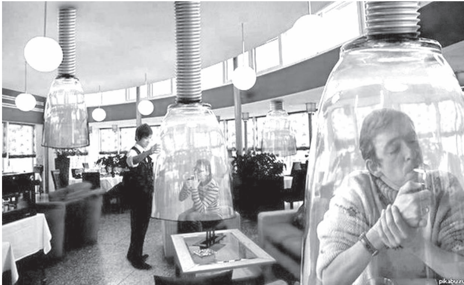
Так курят в японском ресторане

Я понимаю, что нам неоднократно придется спорить с контролирующими органами, потому что у них тоже пока нет окончательного понимания, где можно курить, а где нет, - отметила она. - Не до конца понятен даже механизм, по которому должны действовать владельцы заведений. Что им делать, когда их гость закурирует сигарету? Ведь просто подойти и предупредить человека, что он нарушает закон, уже недостаточно. Теперь игра называется «Попробуй докажи, что ты предупредил».