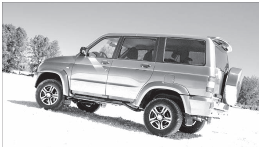
Узнать новую спецверсию можно по шильдику UnLimited на кузове автомобиля

Вариант UnLimited представлен в цвете Quartz Metallic (темно-серый металлик). Эту спецверсию отличают навесные элементы кузова и спойлер с повторителем стоп-сигнала, окрашенные в цвет кузова. Модификация дополнена опцией «Зимний пакет», в состав которой входят электроподогрев лобового стекла, подогрев задних сидений, дополнительный отопитель салона и аккумулятор повышенной емкости.