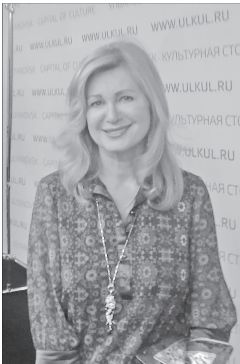
Певица «Андреевского флага» считает «Русскую водку» гениальной песней, но не гимном

- Это я еще мягко высказалась. Могу и жестче. Правда вообще иногда бывает грубой. Я имею право на эту отповедь господину Макаревичу. Еще в конце февраля этого года я была в Крыму. Это было время, когда как раз решалась судьба полуострова и еще не было принято никаких политических решений. Приехала в Крым по собственной доброй воле и за свой счет. Просто поддержать крымчан и увидеть все происходящее собственными глазами. Там не было никого из наших звезд, кто сейчас пиарится на Крыме, включая Макаревича и Пугачеву. Зато потом эти люди, ничего не сделавшие для полуострова, считают, что они вправе раскачивать ситуацию. То же самое было и в Одессе. 10 апреля я побывала там с концертом первой из российских артистов. Могу с уверенностью сказать: город не поддерживал зашланых «правосеков», старающихся с кровью отодрать Одессу от России. Новороссия, пусть не