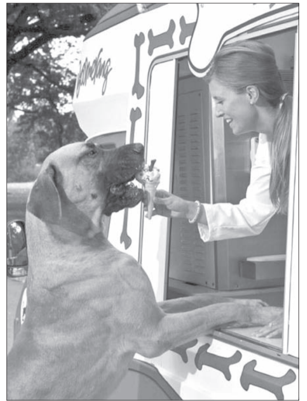
В Лондоне из-за жары собак кормят мороженым